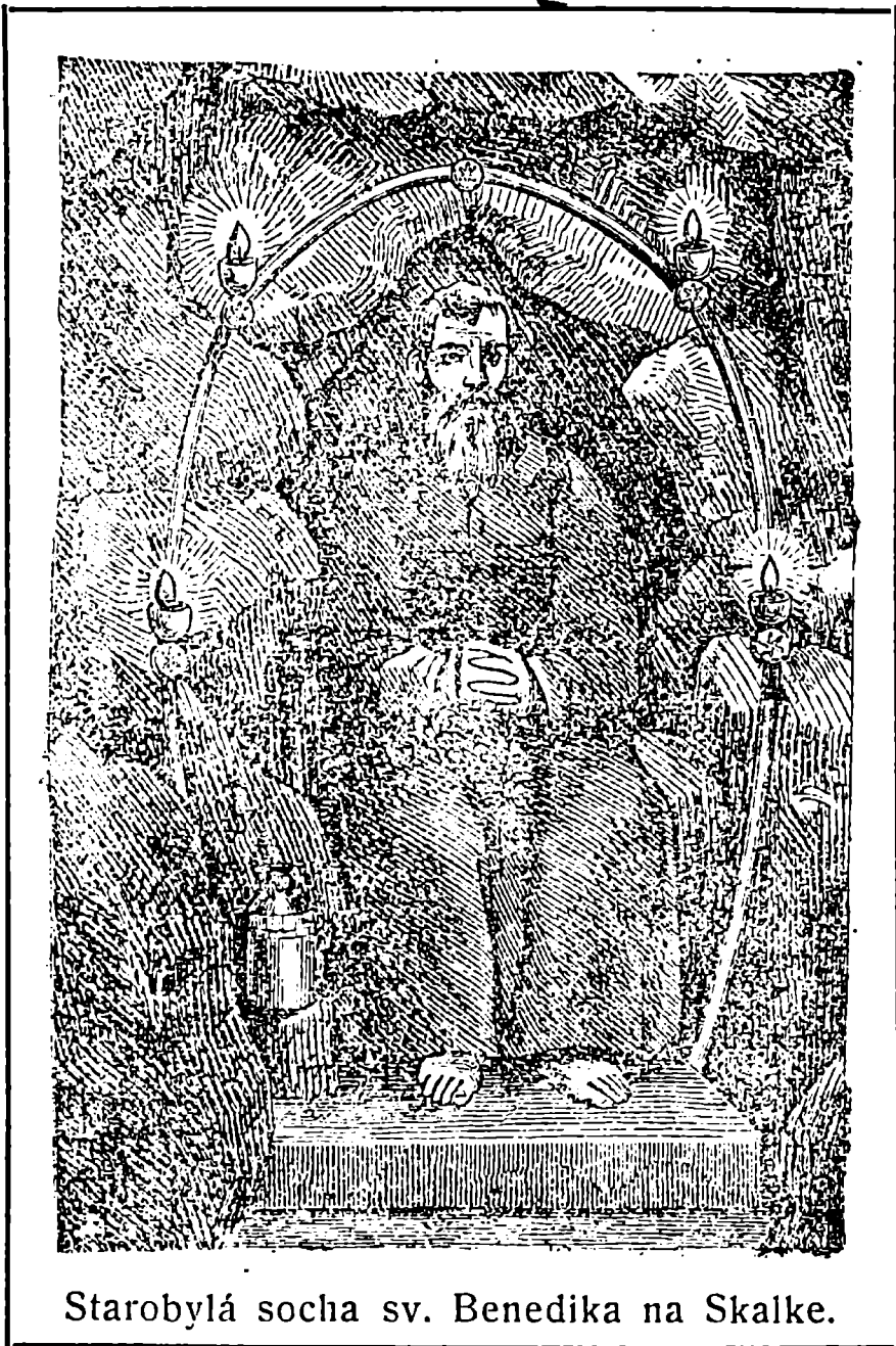
Starobylá socha sv. Benedika na Skalke.

Kedyže povstaneme zo sna hriechov i my?! My často nedbajúc vznešený príklad nášho svätého patróna, tak sa mu vďačíme, že v bahne hriechov sotrvávame.