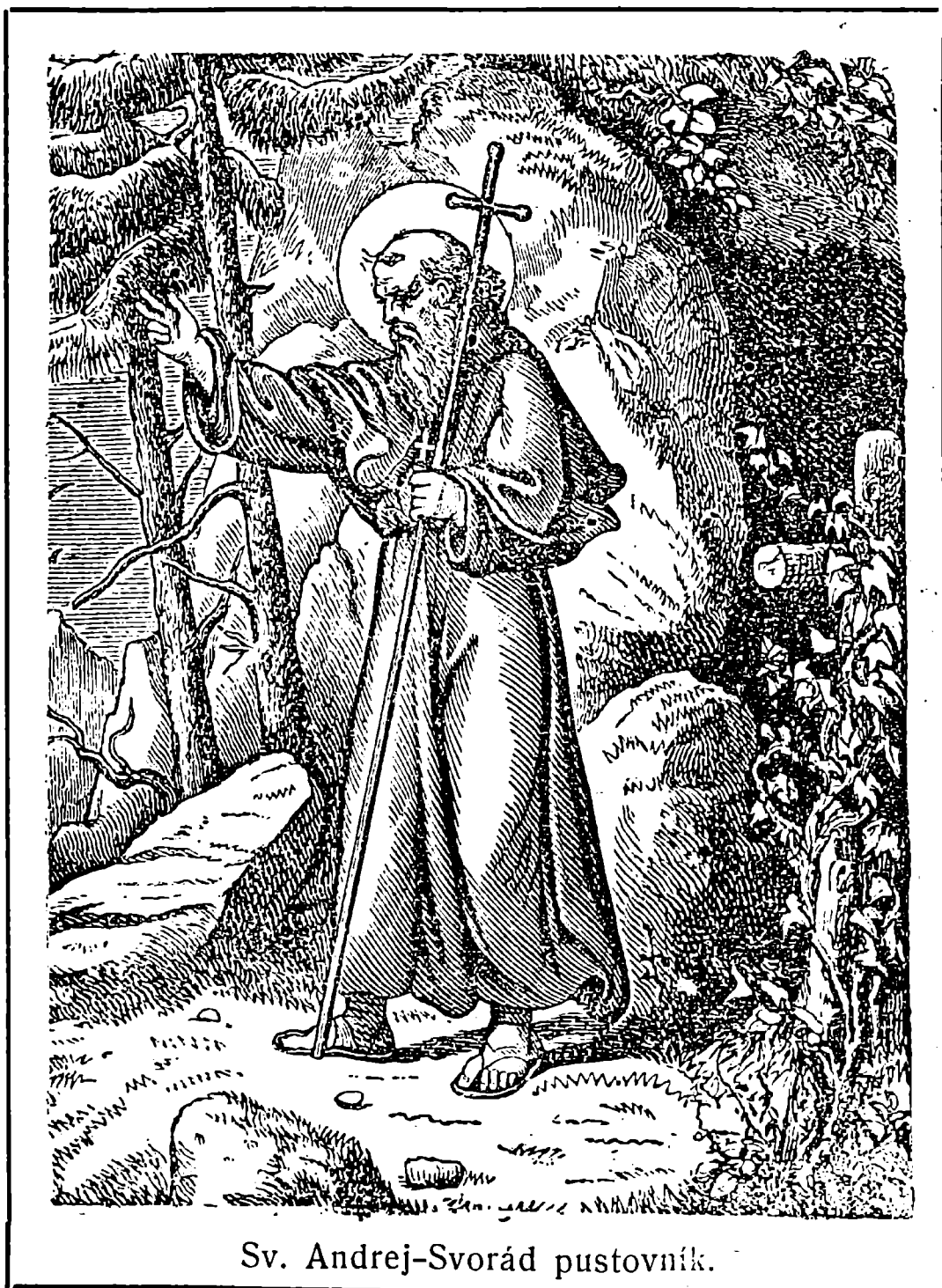
Sv. Andrej-Svorád pustovník.

Staré, často dokázané príslovie hovorí, že príklady tiahnu, totiž, že dobrý príklad človeka akoby núti, aby aj on dobré činil. A skutočne i nebeský náš Spasiteľ J. Kristus učil nielen božským svojim slovom, ale i vznešeným svojim svätým životom. A v tomto nasledovali ho i Jeho vždy verní učenníci, apoštolovia a svätí i vyvolení Boží. Známo je, že apoštol národov sv. Pavel povedal o sebe: Buďte nasledovníkmi mojimi, jako som ja nasledovníkom