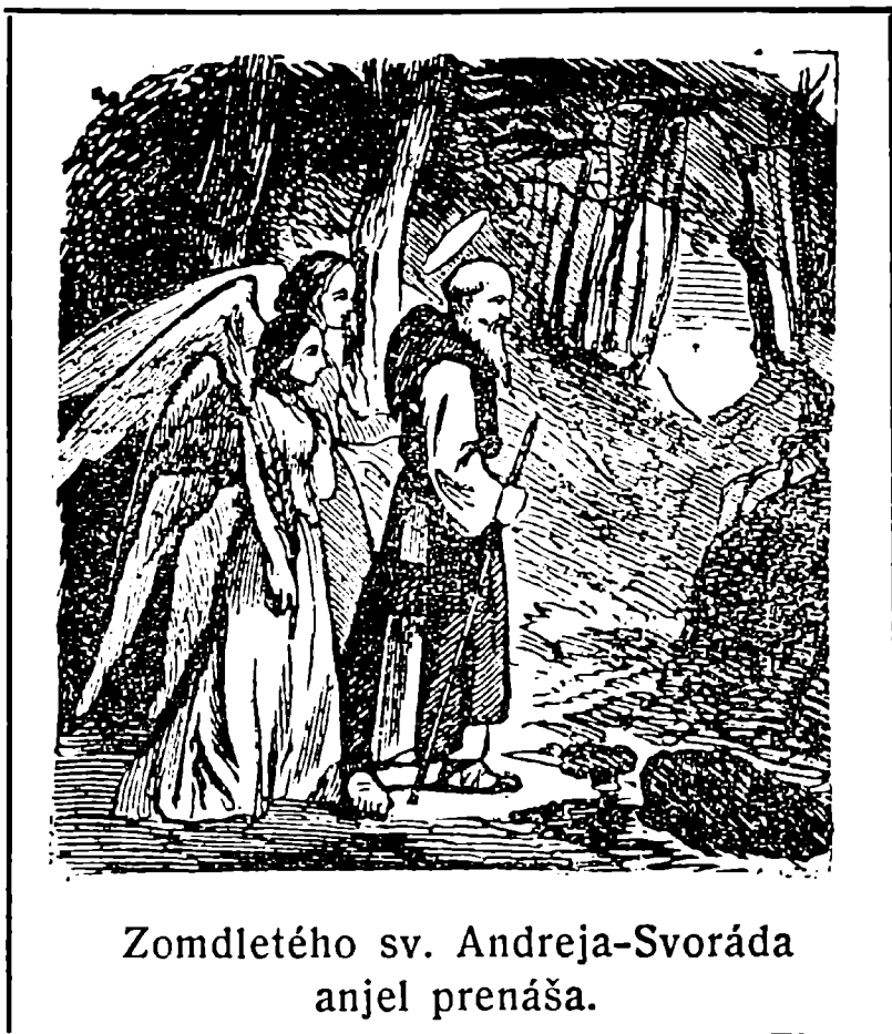
Zomdletého sv. Andreja-Svoráda anjel prenáša.