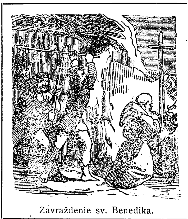
Zavraždenie sv. Benedika.

miňa; pominuly sa i tieto šťastlivé dni. Sv. Andrej-Svorad zomrel a zanechal na tomto svete svojho učenníka v jeho žiali. Aby teda sv. Benedik aspoň zčiasťky ulavil svojej boľasti, presťahoval sa zo zoborského kláštora do jaskyne skalskej, kde ho všetko upamätovalo na jeho učiteľa. Tu on nasledoval vznešený vzor svojho majstra, tu pokračoval v jeho diele, napomáhajúc modlitbou, pôstom, prácou a dobrým príkladom duchovný dobrobyt svojích rodákov. Ale lakomí ľudia za toto jeho veľké dobrodenie hrozným zločinom sa mu odplatili. V nádeji dajakej koristi r. 1012. napadli ho pohanskí lúpežníci, zavraždili a života pozbavené telo z vysokej skaly do rozvlneného Váhu hodili.