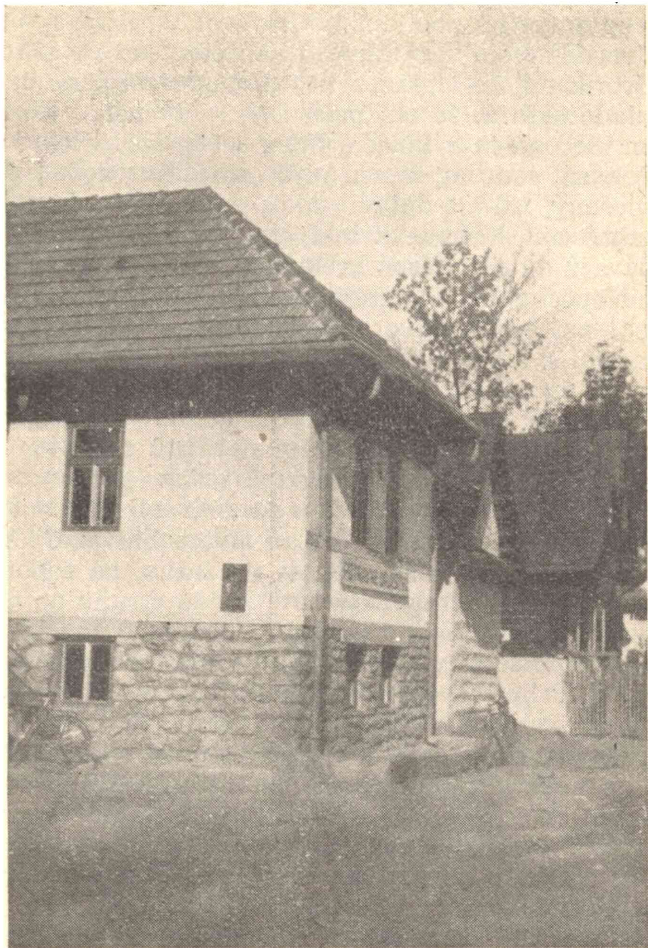
Nové potravné družstvo v Sliáčoch, založ. r, 1938.