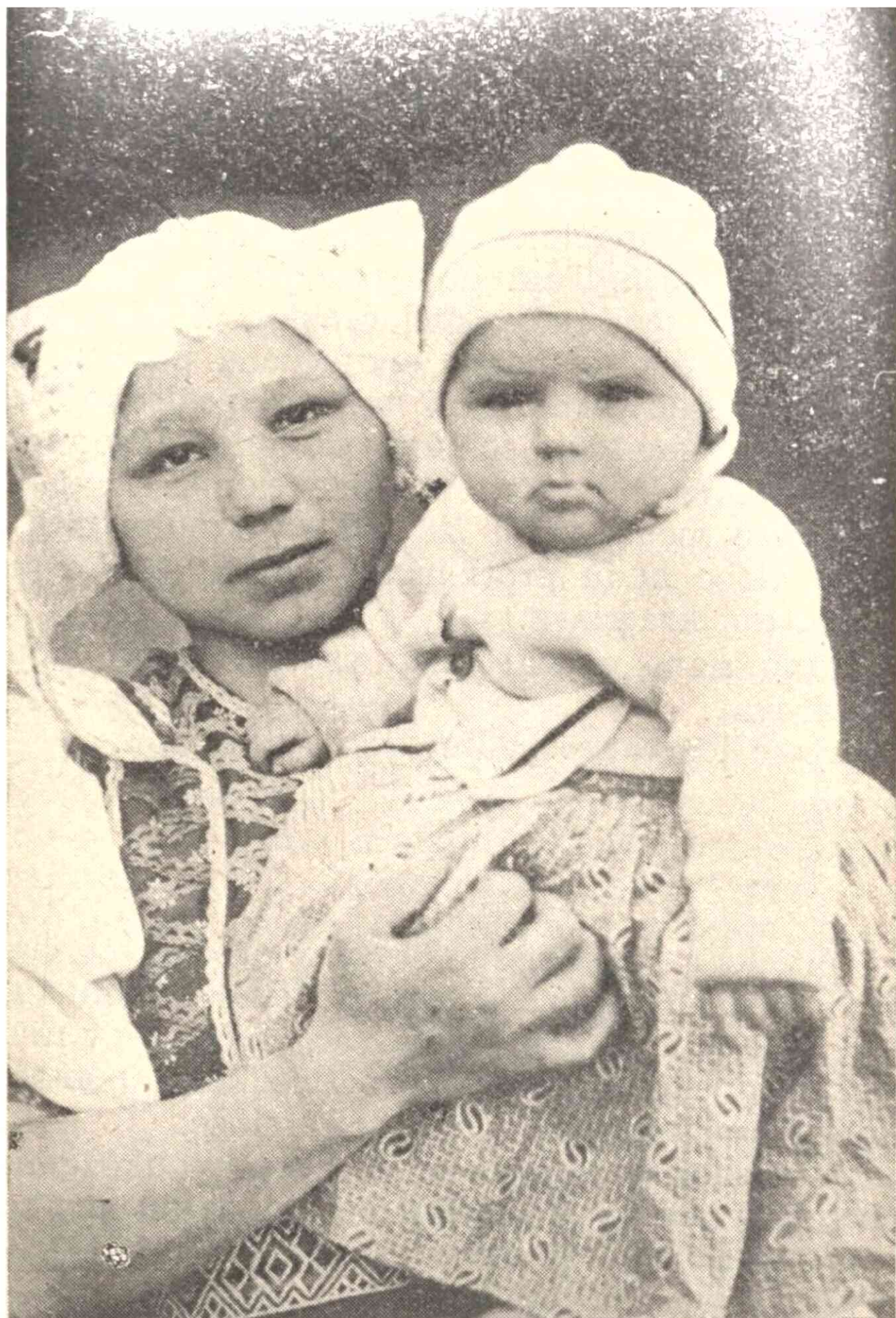
Sličanka s deckom