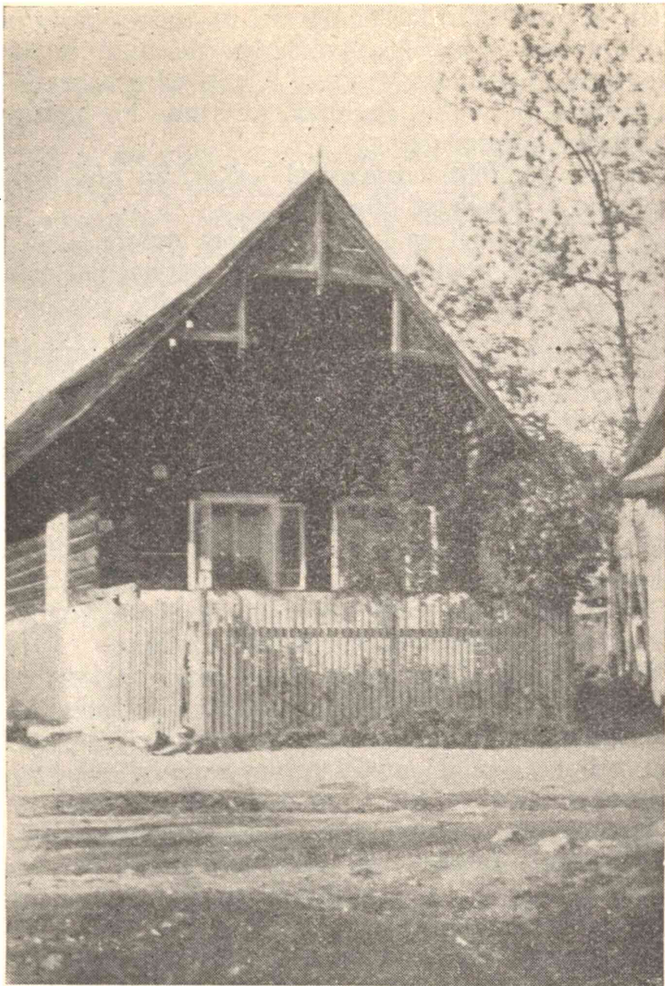
Dom v Sliachi, v ktorom bolo staré potravné družstvo, založené r. 1894.