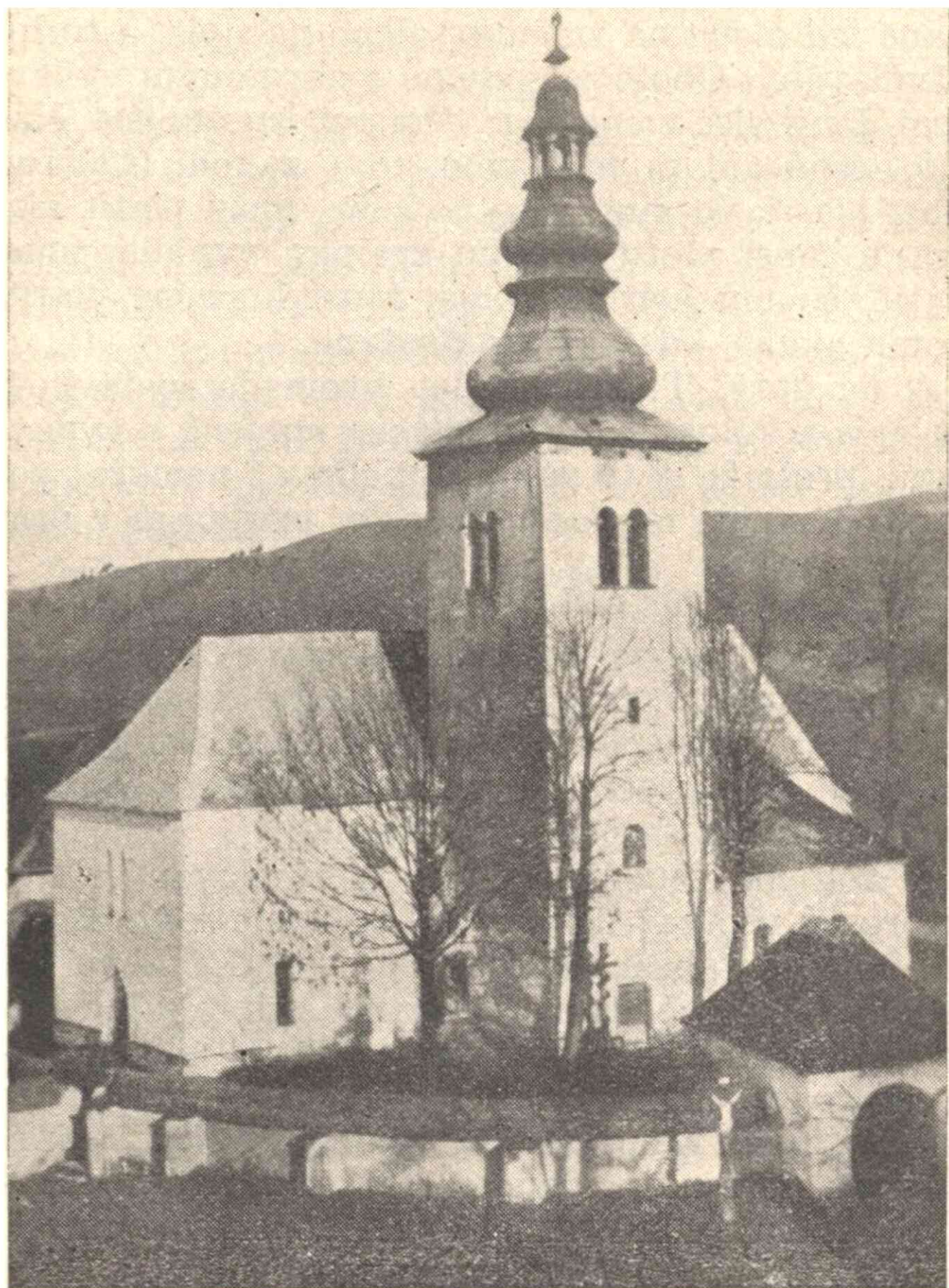
Kostol v Sliachi