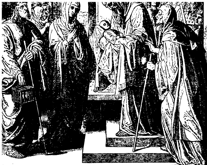
Ukázka vyobrazení: P. Goffine-a „DOMÁCÍ POSTILLA“.