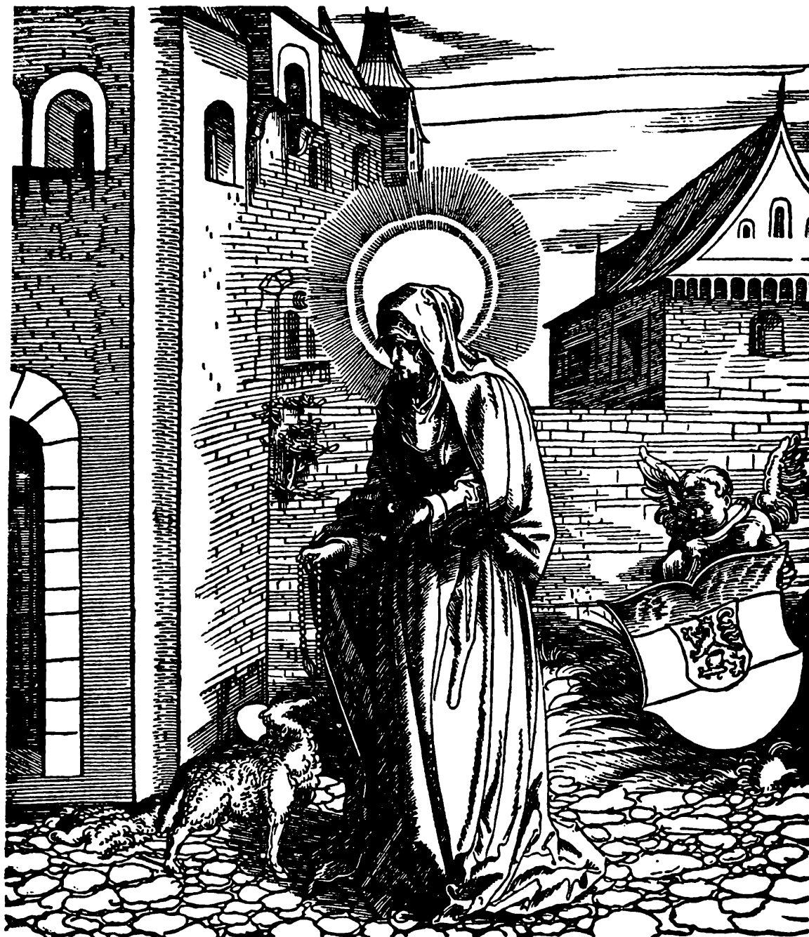
JAN BURGMAIER: BL. ANEŽKA. Dřevoryt z doby okolo r. 1514.

Její jméno Anežka-Agnes, má něco v sobě z beránka — Agnus, z toho beránka, jenž za jiné jest obětován. Jakoby ji za svou šťastnou pokračovatelku vyslaly nejšlechtnější ženy Přemyslovců, kterým bylo souzeno často usmiřovati oběti velké zbožnosti, krvavé stíny svého rodu: Ludmila, Přibyslava, Mlada . . .»