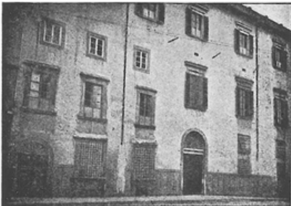
ÚSTAV SESTER SV. ZITY V LUCCE, kde byla Gemma chovankou.