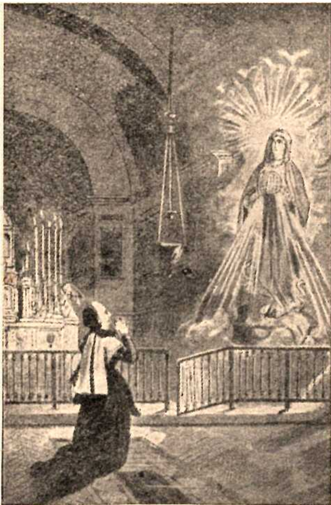
II. zjevení Neposkvrněné Panny ze zázračné medaile.