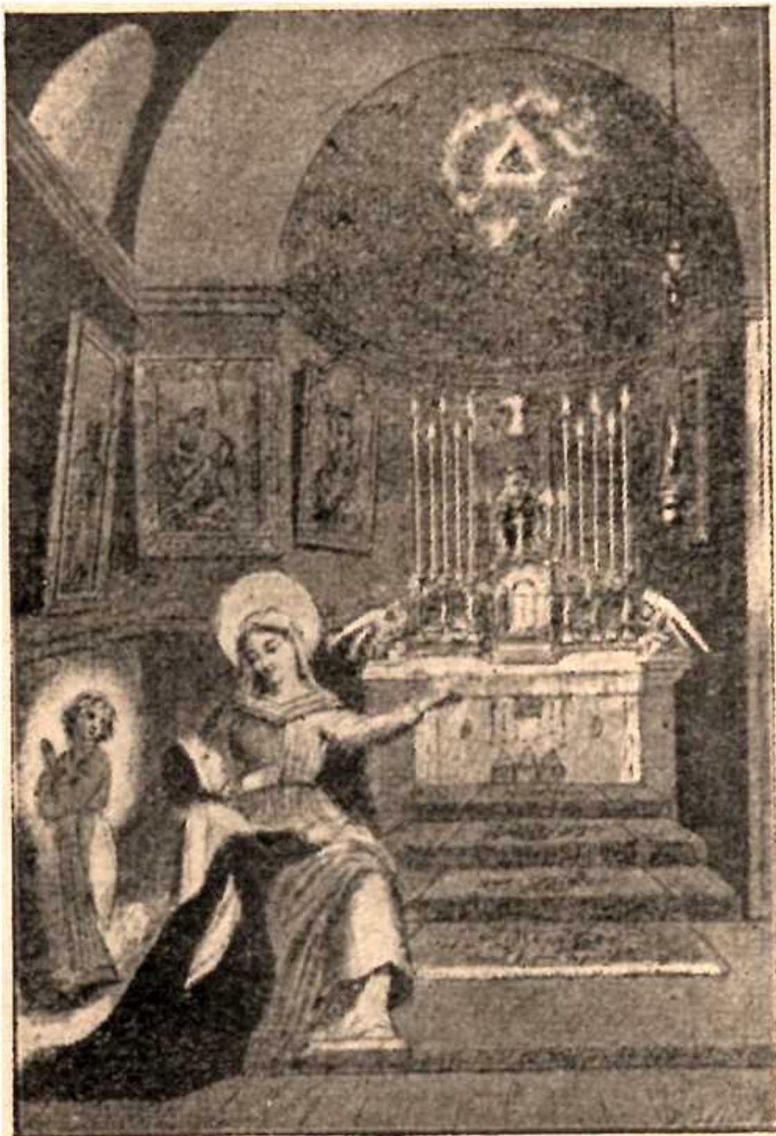
I. zjevení Neposkvrněné Panny ze zázračné medaile.