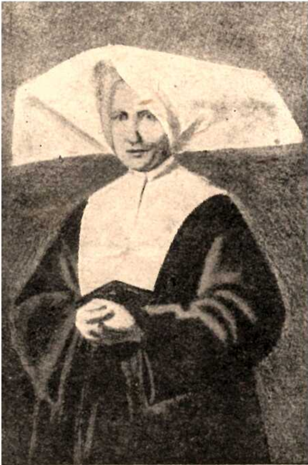
Ctihodná s. Kateřina Labouré, poselkyně Neposkvrněné Panny.