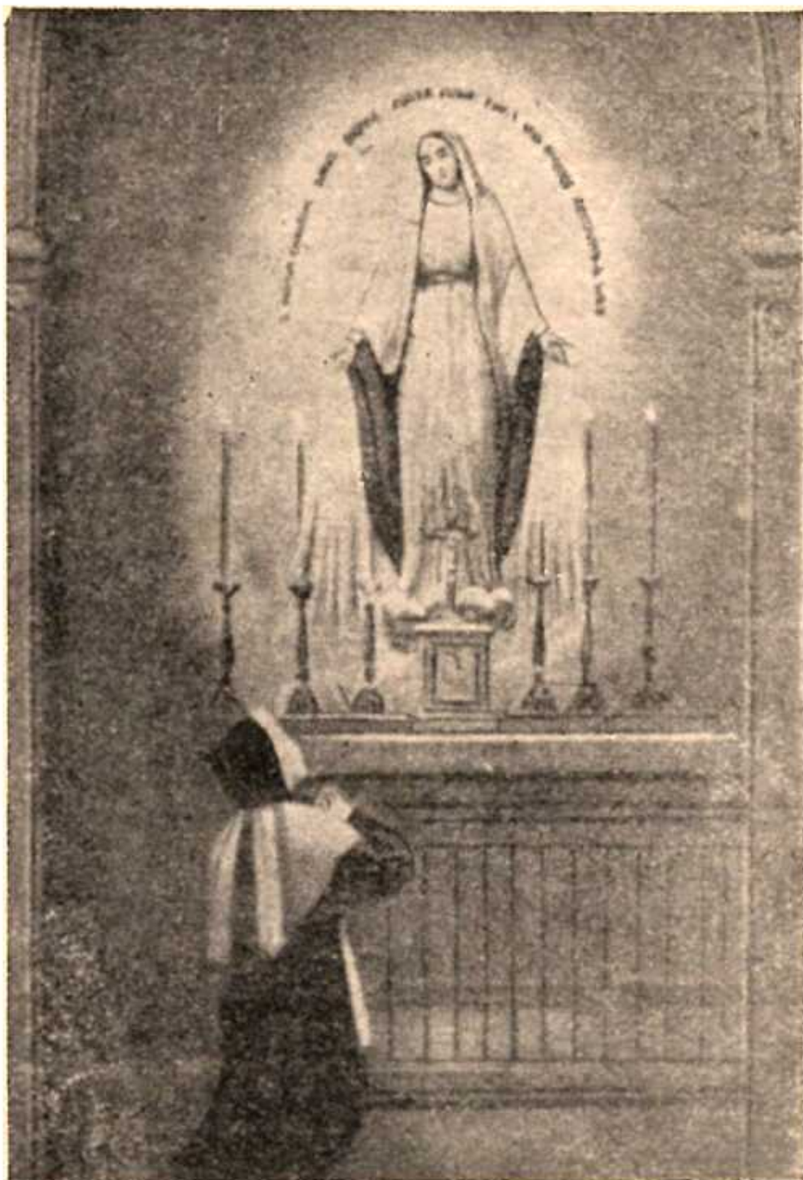
111. zjevení Neposkvrněné Panny ze záračné medaile.