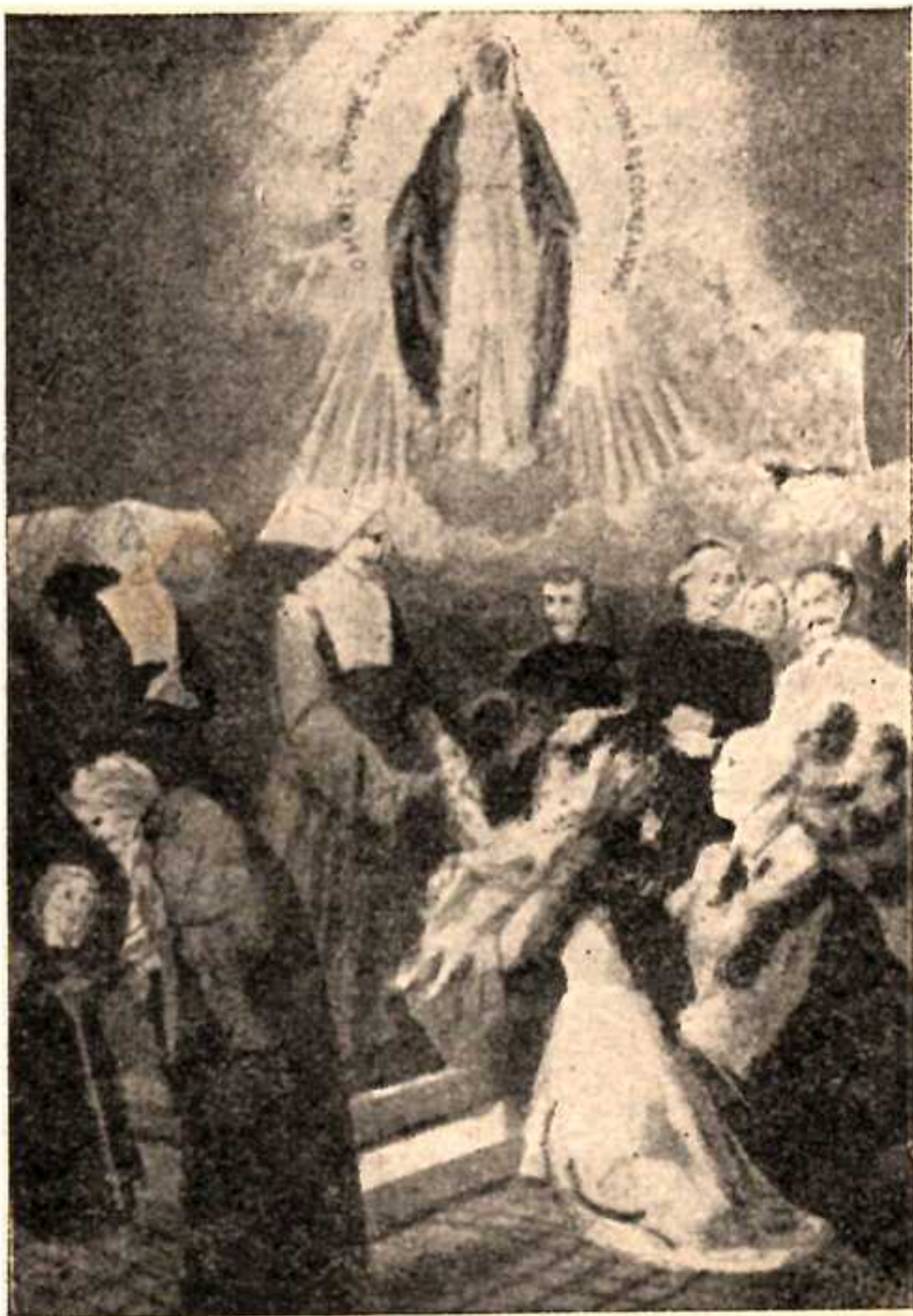
Sestra Kateřina Labouré, poselkyně Neposkvrněné Panny, rozdává zázračnou medaili.