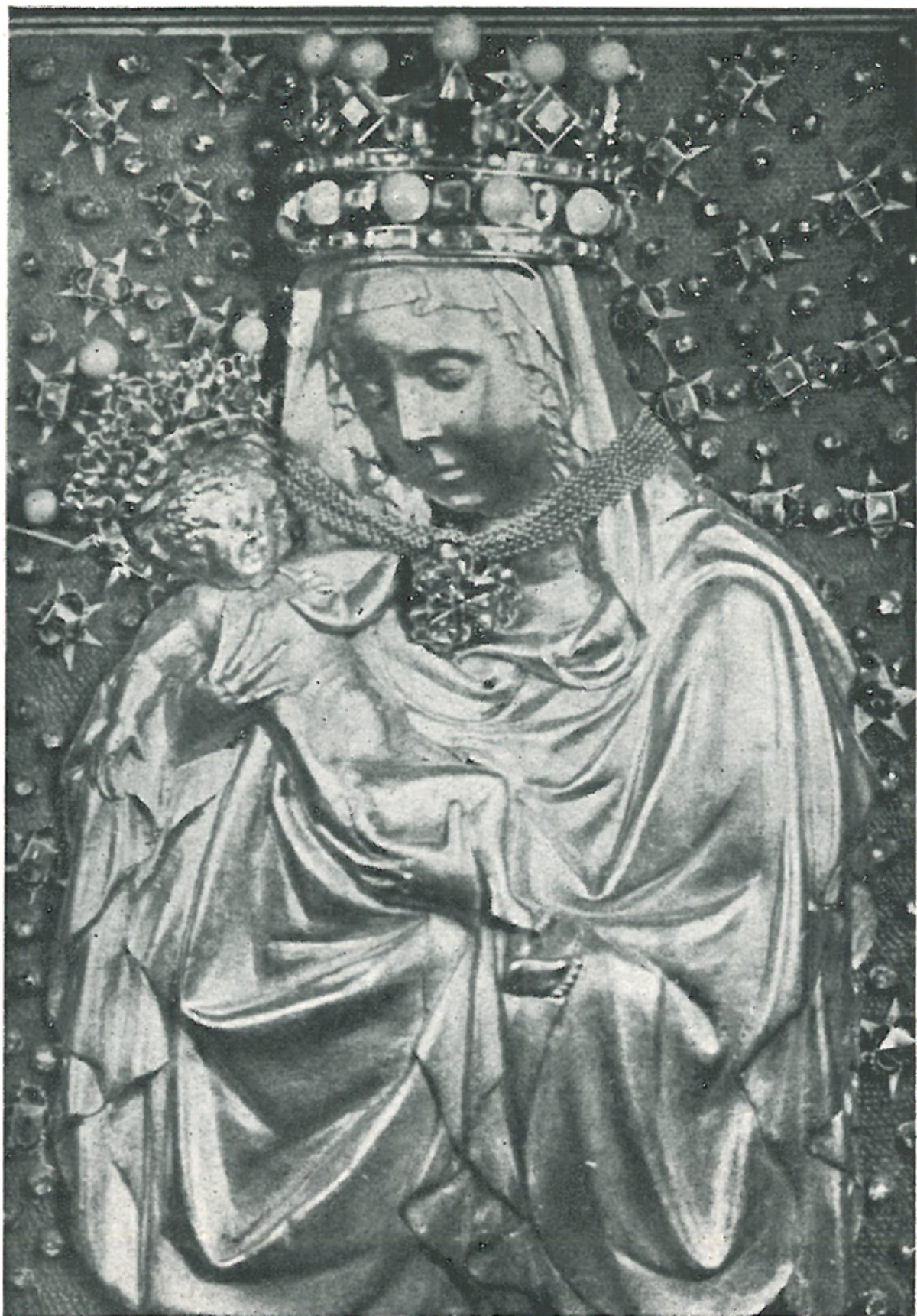
Paladium země České