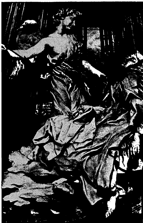
BERNINI: SV. TEREZIE