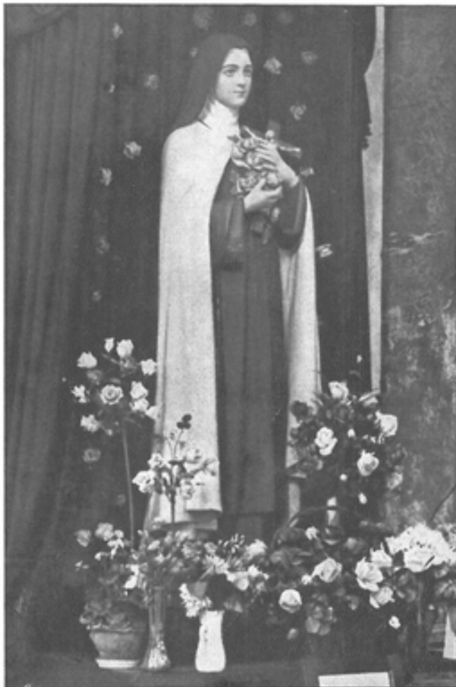
První socha sv. Terezie od Ježíška v Praze v klášterním chrámu u Dominikánů.