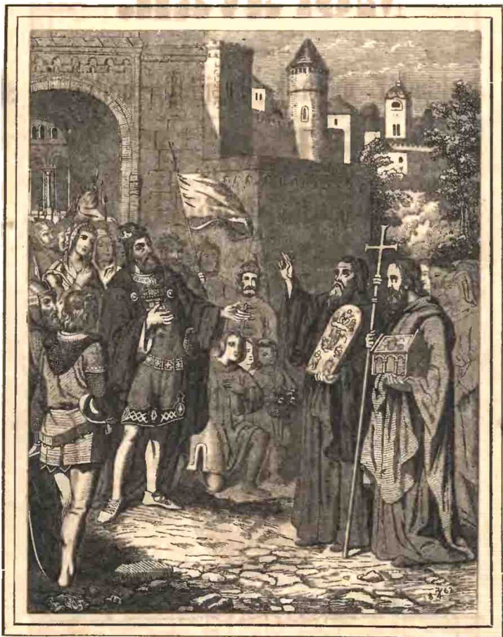
Příchod ss. Cyrilla a Methodia na Velehrad l. P. 863.