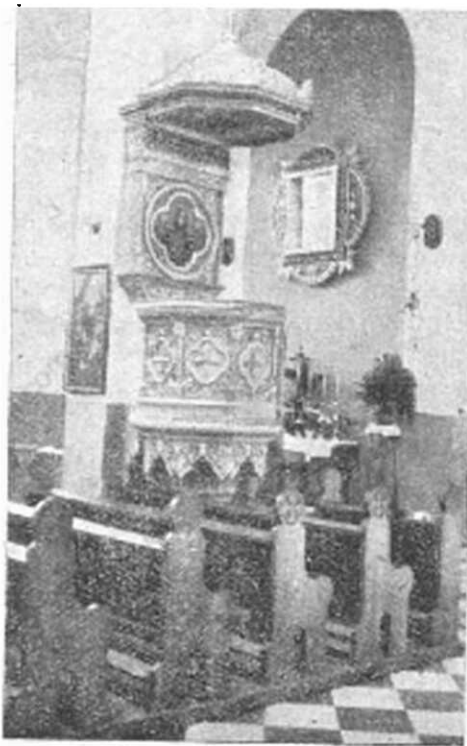
Naša nová kazateľnica.

V jednej chyžke leží mladá žena. Pri posteli stojí kolíska s dieťaťom. Mladý muž vrhol na mňa od pece nie práve priateľský pohľad. »Tu je jeden, ktorý nechodil na misie, ani na spoveď!«, povedal mi kostolník. Už vopred ma informoval, že tento muž nikdy nepride do cerkvi, ale v krčme je ustavične. Nie je korheľ, to nikto nemôže povedať, ešte nik ho nevidel opitého. Vypije denne 10—15 fliaš piva, ale neopije sa. Je to silný chlap.