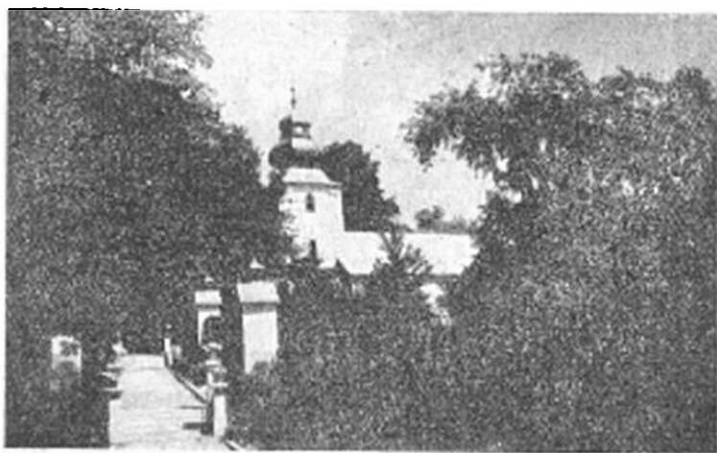
Gréckokatolícky chrám v Humennom.

Priama cesta k Betlehemu je pre kresťanskú matku jej požehnaný stav, keď v jej lone začal sa rozvíjať nový ľudský život. Je to doba vysoko zodpovedná. Matka má chrániť a strážiť život jej sverený od samého Boha a dôverovať v Božiu Prozreteľnosť. Každé dieťa ochotne prijaté prináša nové požehnanie celej rodine, aj vtedy, keď jeho príchod sa vidí rodičom