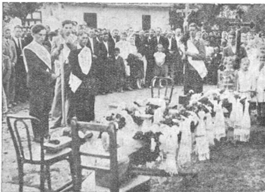
Svätenie misijných krížov v Laškovciach