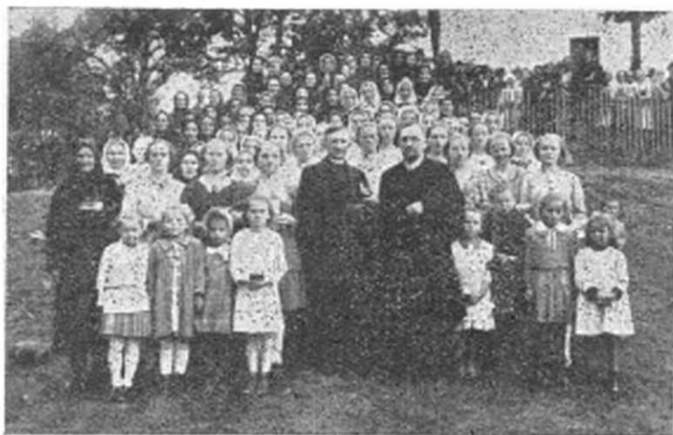
Ružencový spolok v Jovsi

Otec chorej však už od svojej mladosti si navykol v podobných prípadoch vzývať sv. Jozefa. A to bol pravý prostriedok na liečenie. Jedného rána povedal svojej chorej dcére, že sa nijako nebojí ich biedy, lebo všetko vložil do rúk sv. Jozefa. Ten ich neopustí. Nemocná sa tiež obrátila v modlitbe na sv. Jozefa. A kto by tomu veril? Ledva dokončila krátku modlitbu k sv. Jozefovi, cítila sa lepšie. Za dve hodiny nadobudla takých síl, že mohla vstať a pracovať. Ľudia ani svojim očiam neverili, keď ju videli celkom zdravú. Potom sa o nich sv. Jozef tak staral, že ich núdza sa premenila v blahobyť.