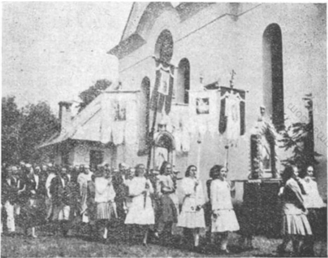
Obchod v Pozdišovciach.