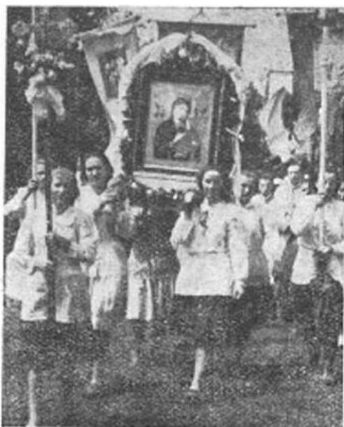
Procesia z Topoľan.

Boh ťa môže hocikedy zavolať na účtovanie. Rozpamätaj sa na podobenstvá o múdрых a nemúdрых pannách, o kráľovi, ktorý dal svoj majetok do rúk šafárov. Pán prišiel, kedy ho nečakali. »Preto i vy buďte hotoví, lebo neviete, kedy Syn človeka príde!« — napomína nás Spasiteľ. Nevieťme, kedy príde smrť, teda radšej ty ju očakávaj!