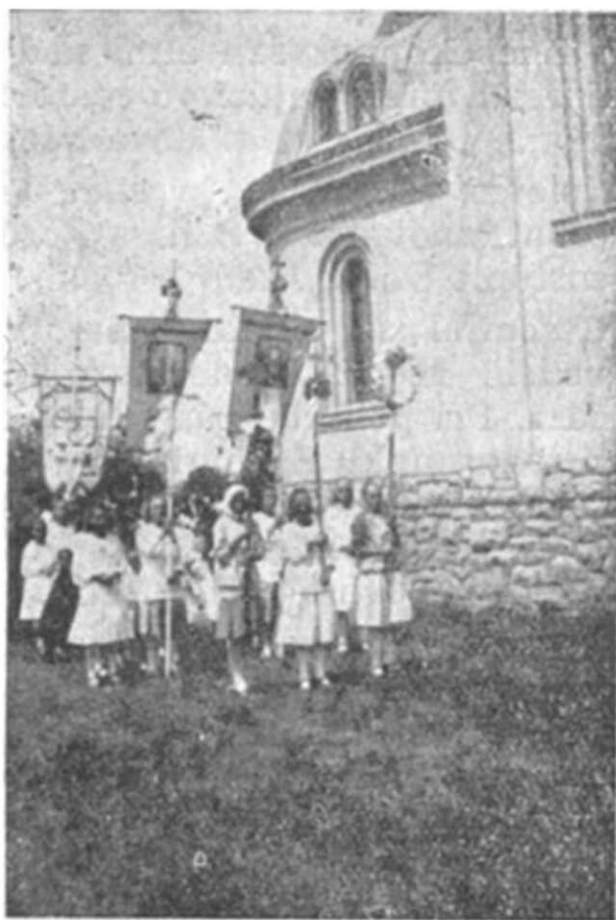
Z odpustu v Michalovciach!