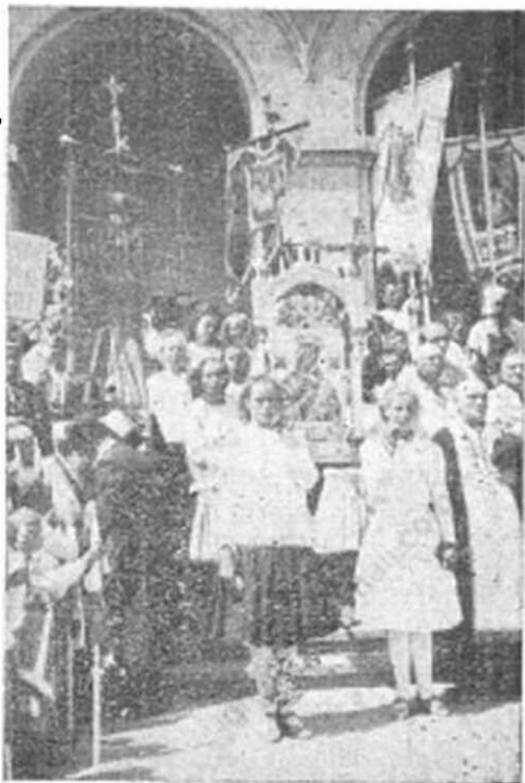
Z odpustu v kláštore. (Obraz M. U. P. z Pozdítovlec.)

Matička Božio, Matička moja, na veky chcem byť, na veky tvoja. Betuška.