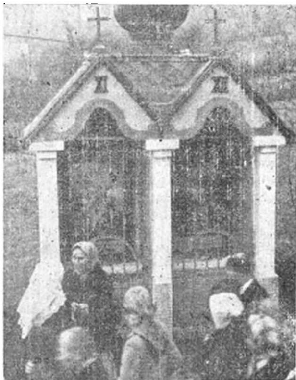
Na gréckokatolíckej Kalvárii v Humennom.

Podakujte Isusovi za jeho vykúpenie! Zúčastnite sa na prekrásnom odpuste „ Vozdviženija “ na našej prvej gréckokatolíckej Kalvárii na Slovensku v Humennom!