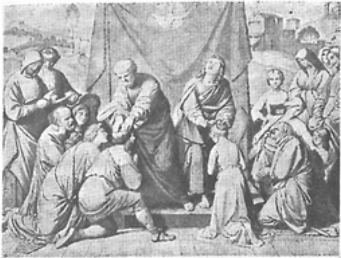
Sv. Petr a Jan biřmují v Samařii.

ruce, přišel na ně Duch Svatý“. Toto vzkládání rukou, kterým se uděloval Duch Svatý, mohl ustanoviti toliko Pán Ježiš. Vzkládání rukou má totiž zcela jinou milost než křest, a tu jen Kristus Pán s ním mohl spojit. Apoštolové konali pak jen to, co Kristus ustanovil. Proto také Církev svatá vždy učila, že biřmování je pravá, Ježíšem Kristem ustanovená svátost.