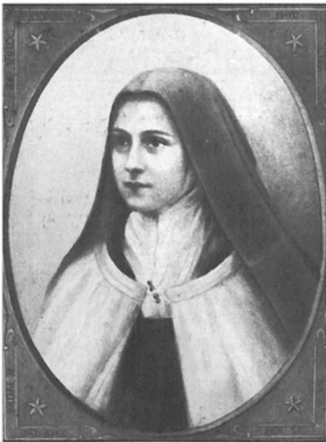
Sv. Terezie Ježíškova.