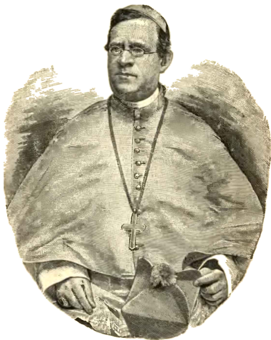
Biskup Karel Schwarz.