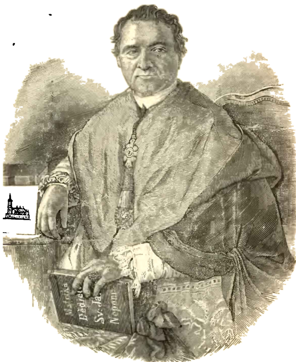
Kanovník Václav Pešina.