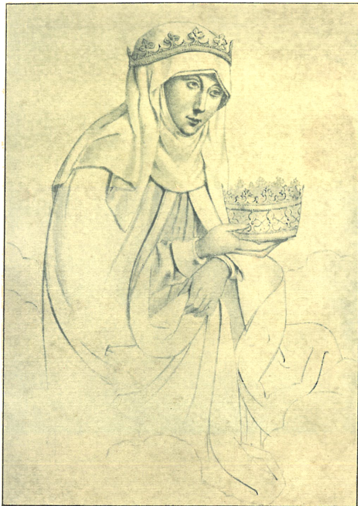
SVATÁ ALŽBĚTA MATKA CHUDÝCH A NEMOCNÝCH