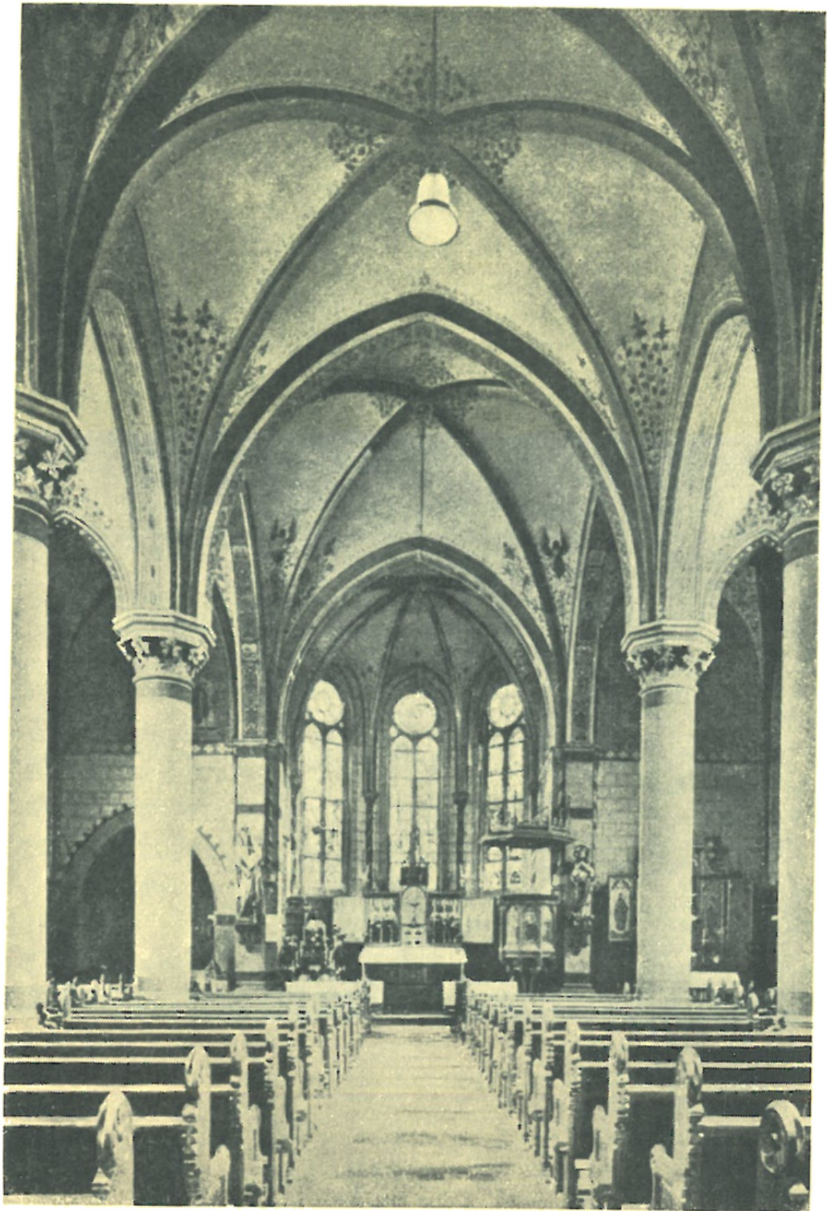
Vnitřek farního kostela v Eisenachu.