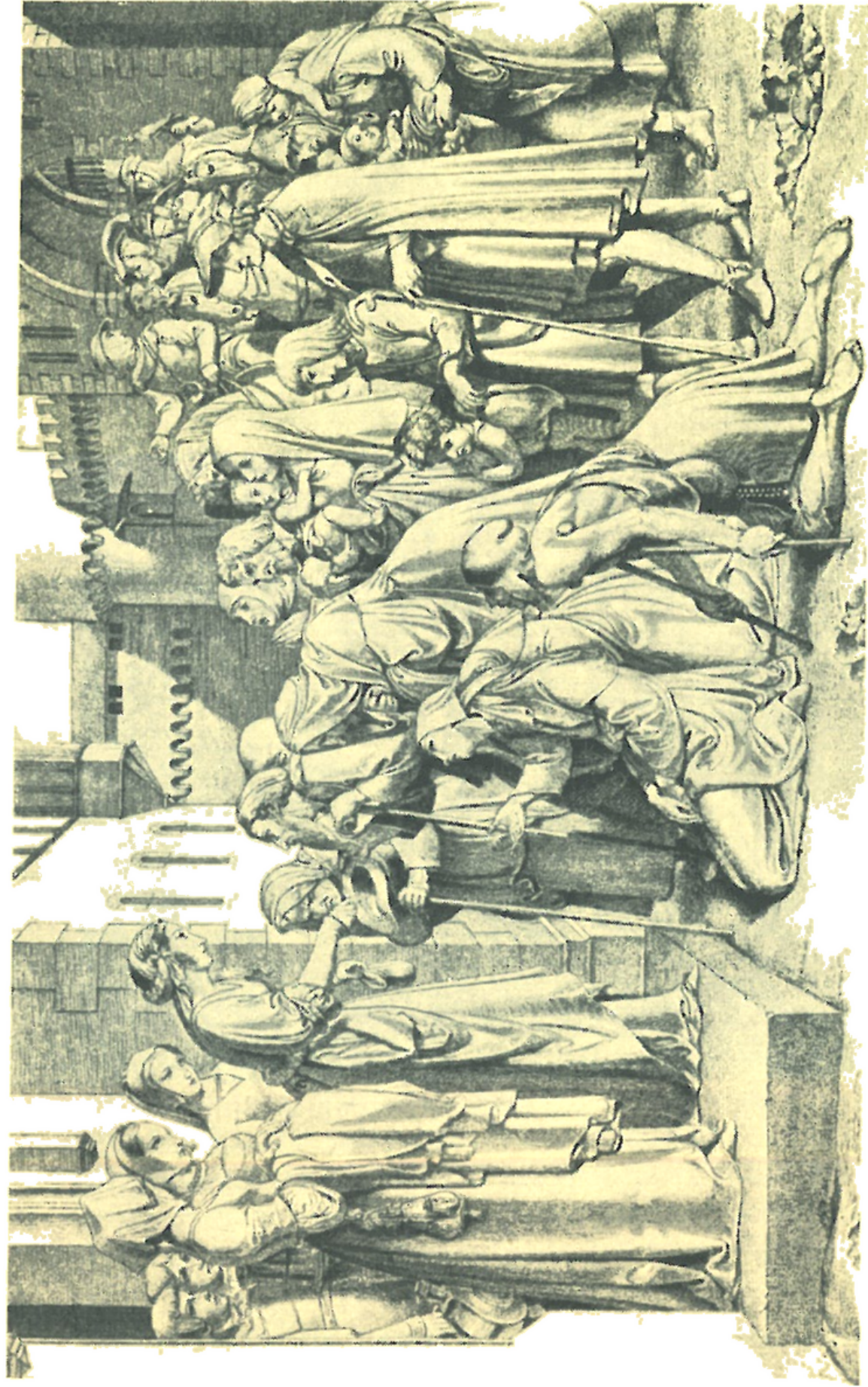
H. Nāke: Svatá Alžběta.