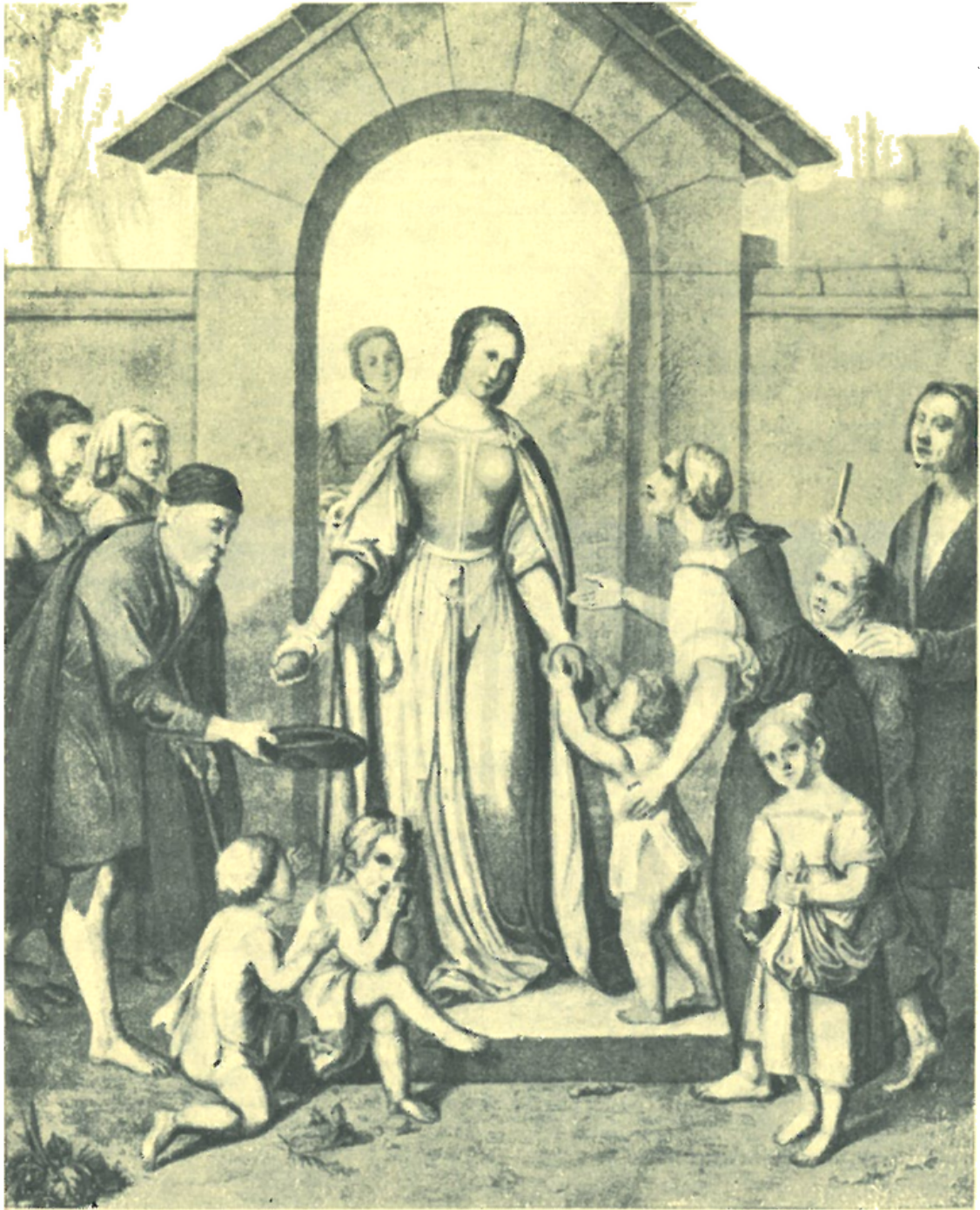
Luisa Seidlerová: Sv. Alžběta rozděljuje almužnu.