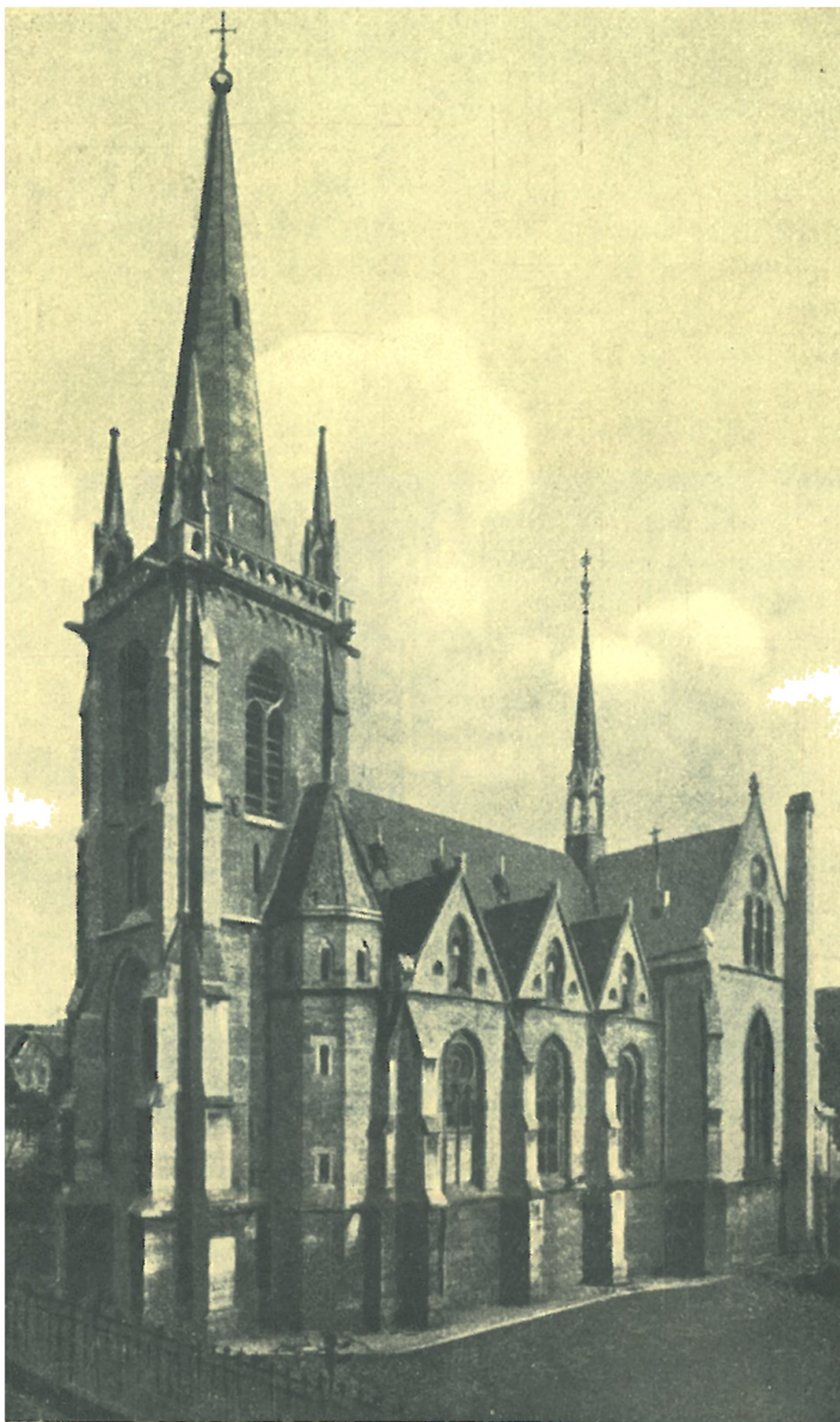
Kostel sv. Alžběty v Eisenachu.