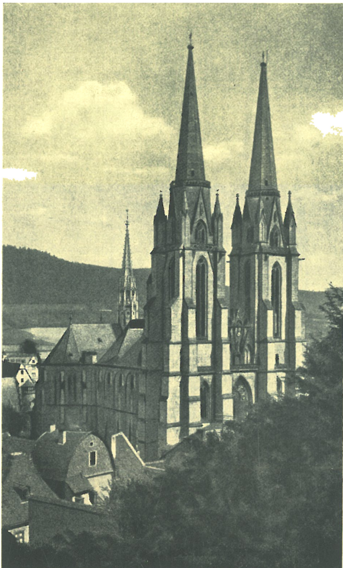
Kostel sv. Alžběty v Marburku.