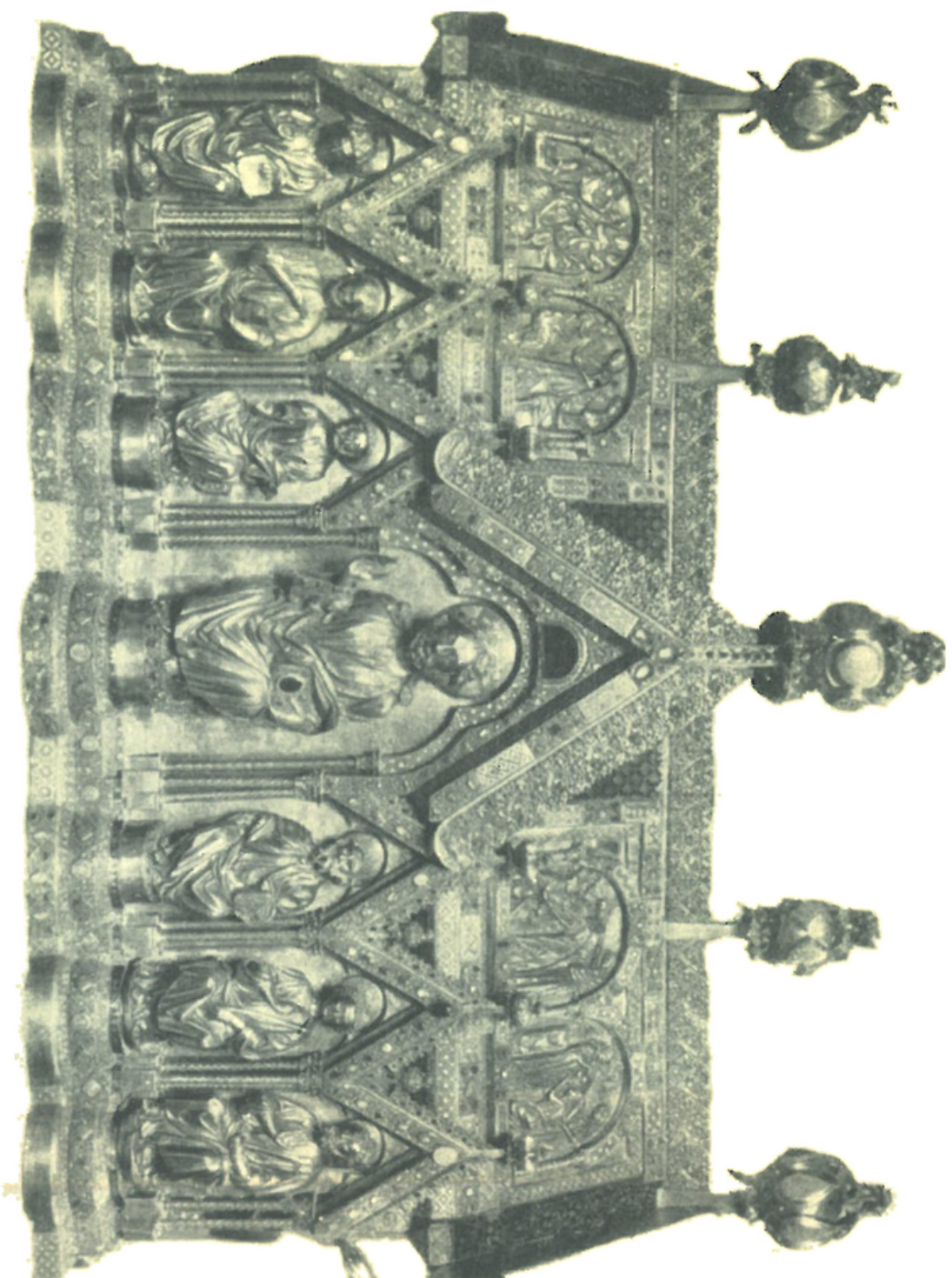
Skříň s ostatky sv. Alžběty.