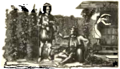
Čtvrte měřice a domuřla powětrnořt.

Dne 1. 15. Třdri, slawnořt pod zelenou*; dne 2. 16. Třdri, slawnořt druhá*; dne 7. 21. Třdri, slawnořt ratoleřj; dne 8. 22. Třdri, fonec slawnořti pod zelenou*; dne 9. 23. Třdri, rakořt z obdrženj zářona*; dne 17. 1. Marřeffwan, dne 31. 15. Marřeffwan.