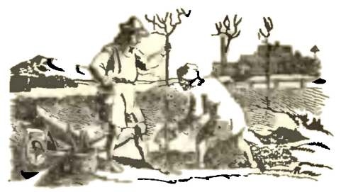
Čtvrtí měsíce a domnělá povětrnost.