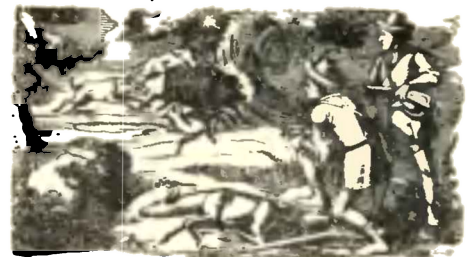
Čtvrté měsíce a denní povětrnost

Dne 1. 16. Maršesswan; dne 15. 1. Kisev; dne 30. 16. Kisev.