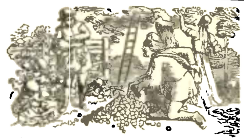
Čtvrté měsíce a denní povětrnost.

☾ Poslední čtvrt dne 8. w 0 hod. 4 min. obpoledne. Deštivo. ● Nový měsíc dne 15. we 7 hod. 6 min. před polednem. Větrno a nešále. ☽ První čtvrt dne 22. w 2 hod. 12. min. ráno. Proměnlivo. ☽ Dupluč dne 30. we 2 hod. 37 min. ráno. Chladno a deštivo.