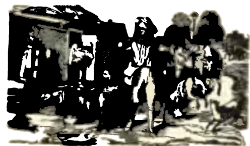
Čtvrti měsíce a domnělá povětrnost.

☉ Duplučt dne 5. w 7 hod. 59 min. před wolebnem. ☾ Wětrno a deštivo. ☽ Poslednj čwrt dne 12. w 8 hod. 14 min. večer. ☽ Za wětru ob sewero-wýchodu kraštré. ☽ Nový měsje dne 20. w 7 hod. 44. min. večer. ☽ Wěné počasj rodrjuge. ☽ Prwnj čwrti dne 27. w 9 h. 2 m. večer. Wěné počasj zá se bhji bhtelné.