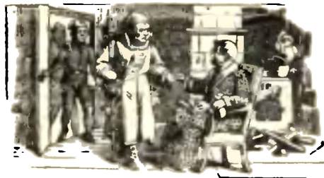
Čtvrti měsíce a domnělá povětrnost.