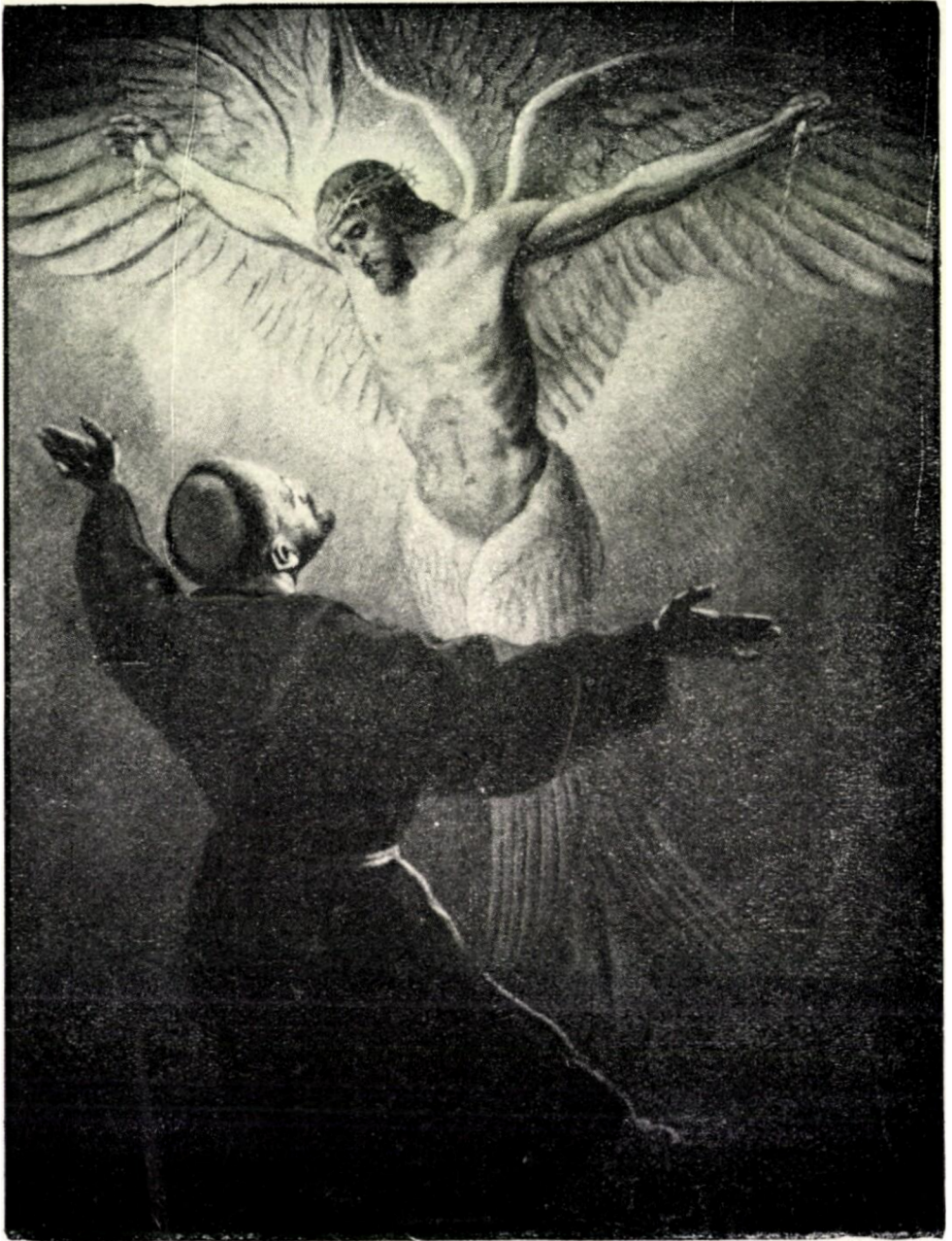
STIGMATISACE SV. FRANTIŠKA. Podle obrazu Fil. Schuhmachera.