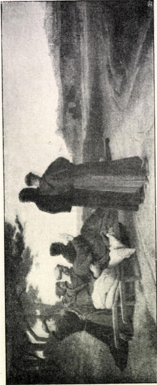
SV. FRANTIŠEK PŘED SMRTÍ ŽEHNÁ ASSISI.