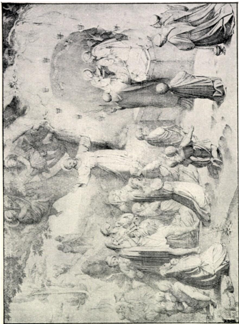
JESLIČKY SV. FRANTIŠKA. Podle kresby Eduarda Steinle.