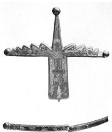
XV. Přilba svatováclavská. Výzdoba nánosku a ztužovacího pásku.

Kroužkové košile staly se nezbytným kusem franské výzbroje a byly hotoveny v takovém množství, že byly vyváženy jako hledaná součást výzbroje, takže Karel Veliký v známém capitulare Thionvillském z r. 805 a v mladším Bononském výslovně zakazoval »ut arma et brunias non ducant ad venundandum«[35] Jak vysoko byla tato brnění ceněna, je viděti z capitulare Karla Velikého z r. 805, kde se nařizuje mužům, majícím nejméně 12 mansů, aby si opatřili brnění a tato, jako dědictví, měla býti v rodině zachována[36]