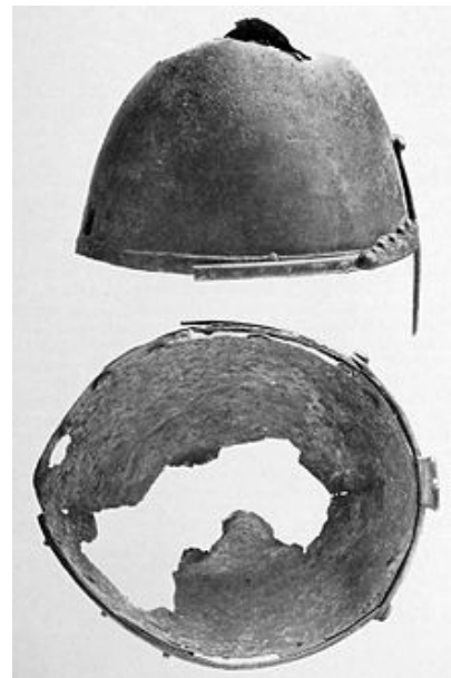
XIV. Přilba svatováclavská. Pohled s pravé strany a vnitřek přilby v němž jsou znatelná vyspravená místa.

Vytkli jsme dva mezní body, mezi které je možno typologicky vsunouti přilbu svatováclavskou. S jedné strany jsou to germánské přilby páskové, sestavené z několika částí nýtů spojených, na druhé straně v mladší skupině se objevuje konická přilba normanská s násoskou, vykutá z jednoho kusu.