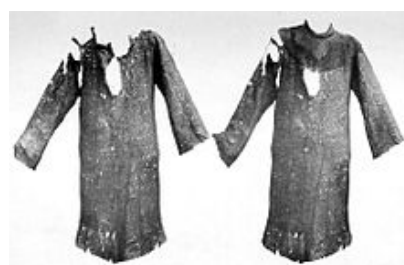
XVI. Brnění svatováclavské. Košile bez pláštíku (vlevo). Košile s pláštíkem (vpravo).