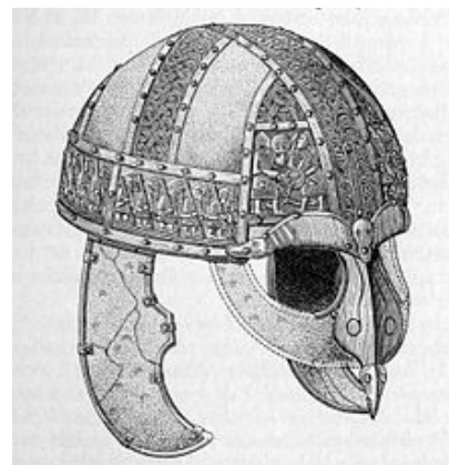
Obr. 1. Přilba z Vendelu ve Švédsku. (Podle H. Stolpeho a T. J. Arneho.)