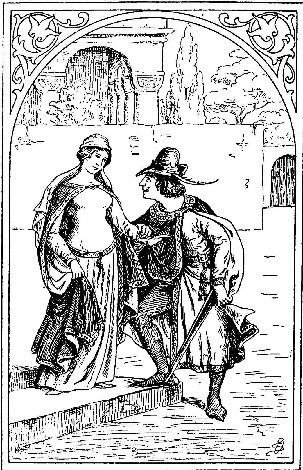
Marketino první setkání s majitelem vily Palazzi v Montepulciano.