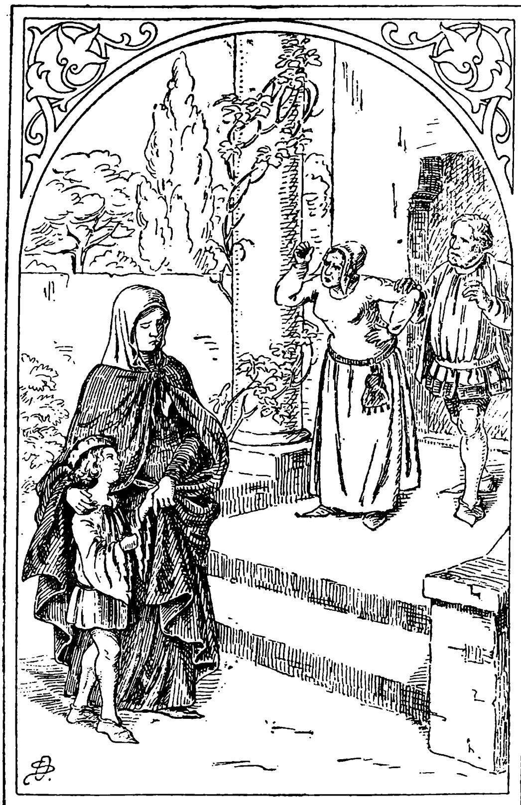
Marketin příchod do otcovského domu.