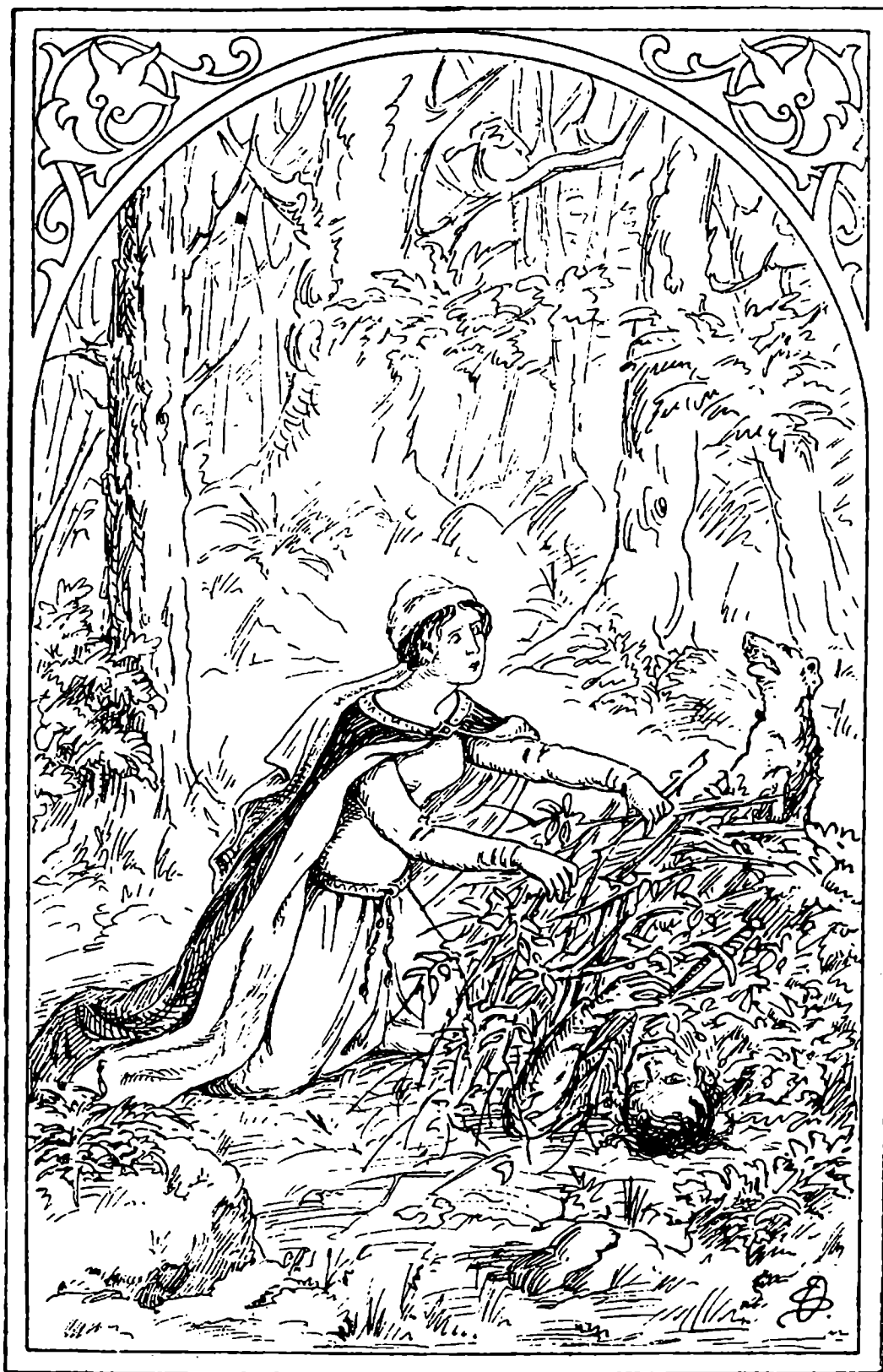
V Petrignanském lese.