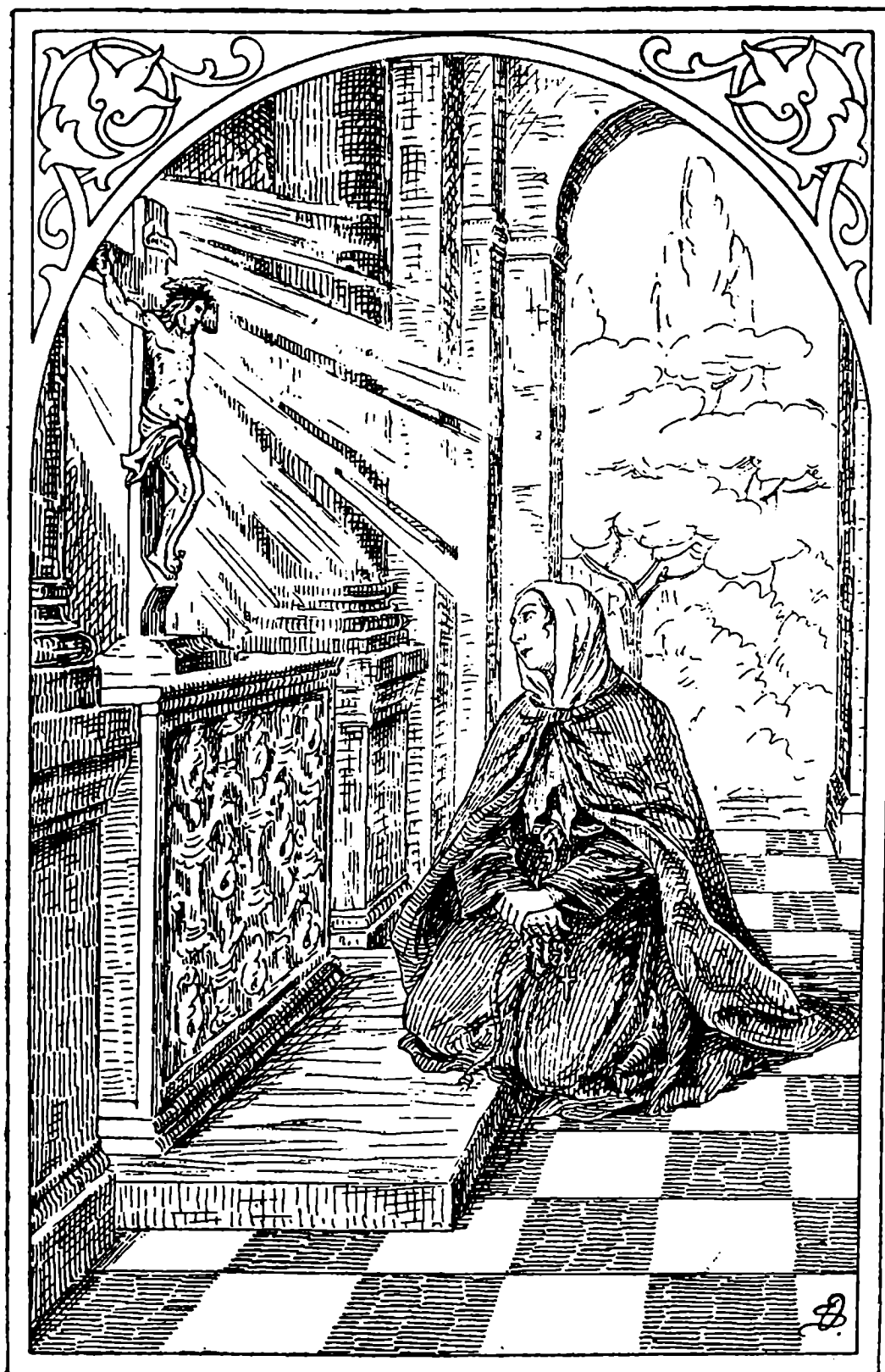
Sv. Marketa před zázračným křížem.