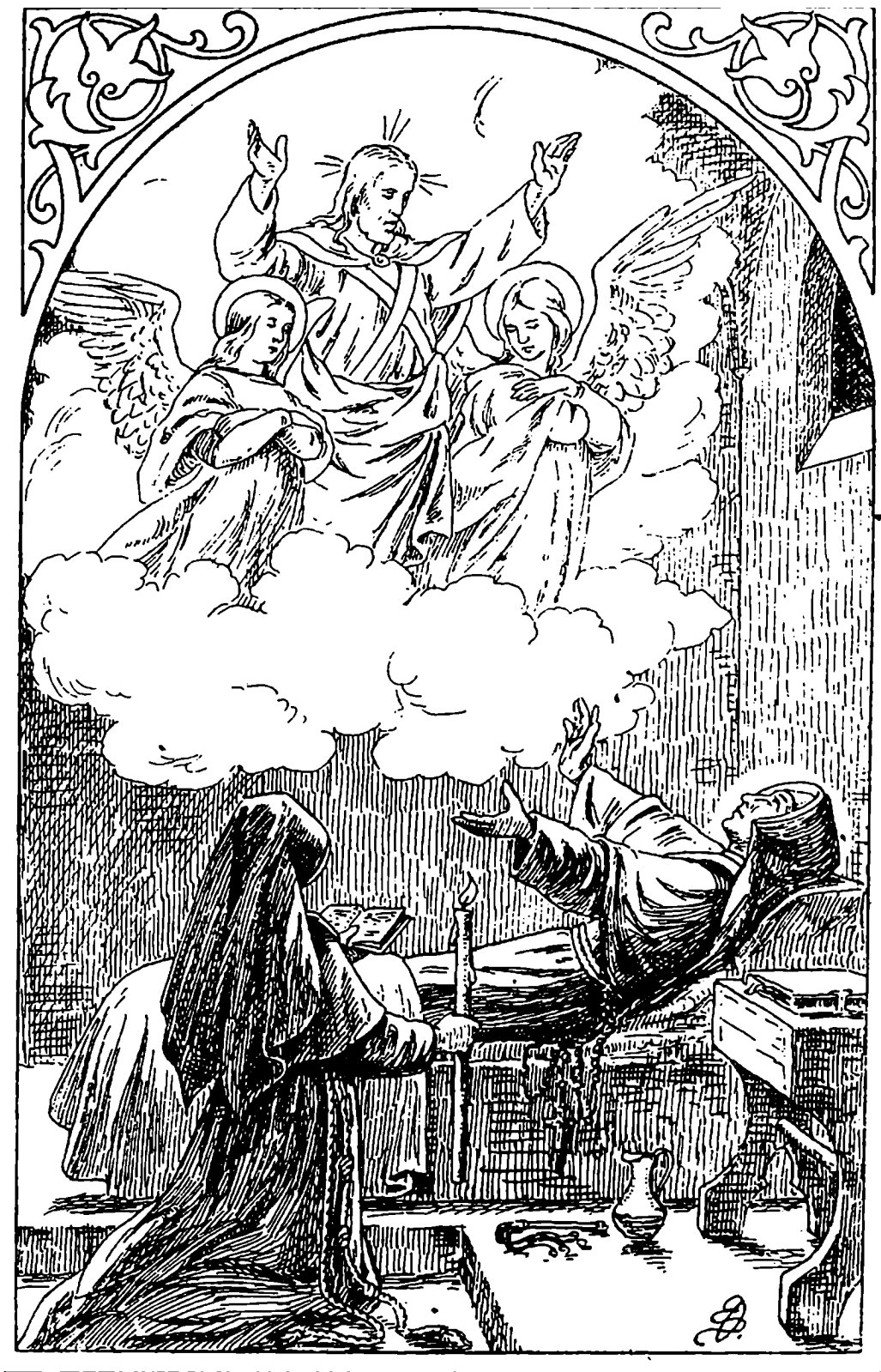
Smrt sv. Markety.