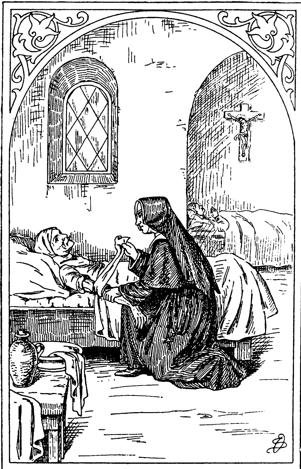
V domě milosrdenství.