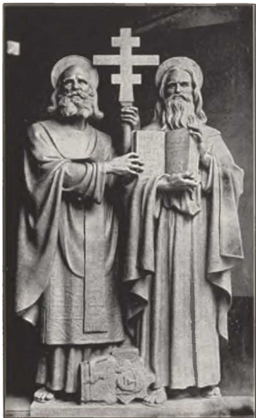
Sv. Cyrile a Metoději, orodujte za nás!