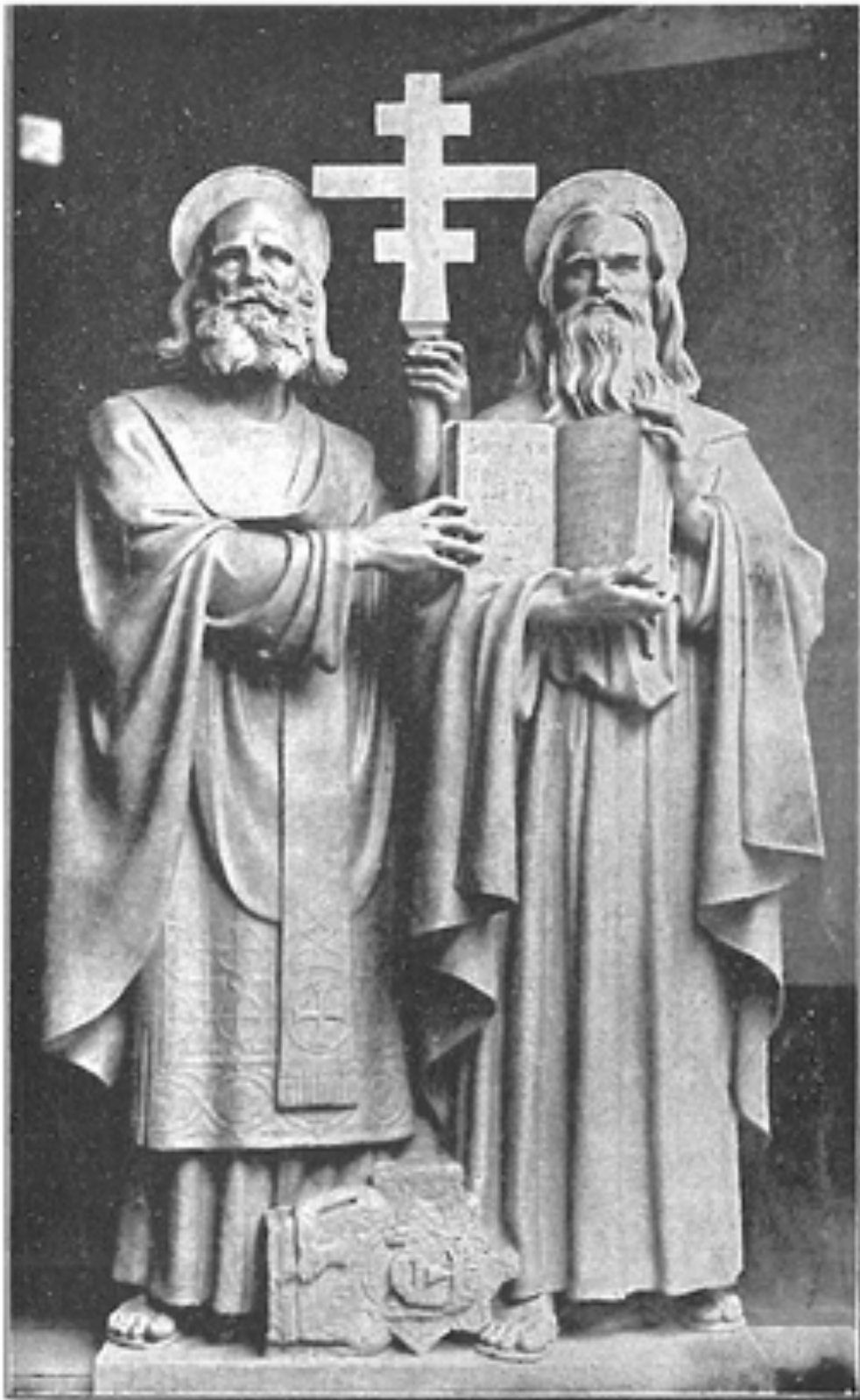
Sv. Cyrile a Metoději, orodujte za nás!