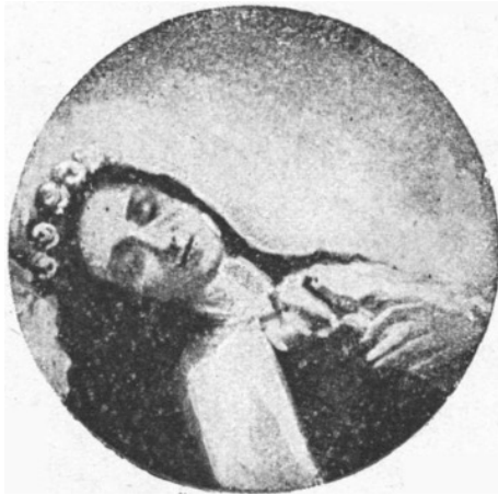
Terezka v rakvi.