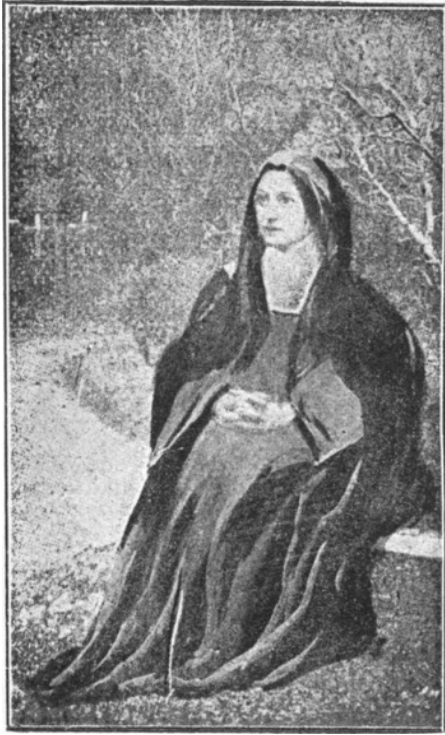
Terezka v kláštore.