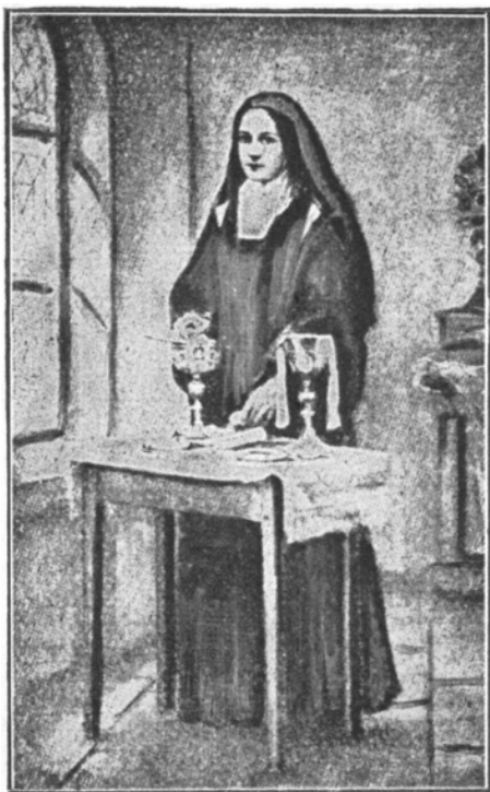
Tereška v zákrstí.