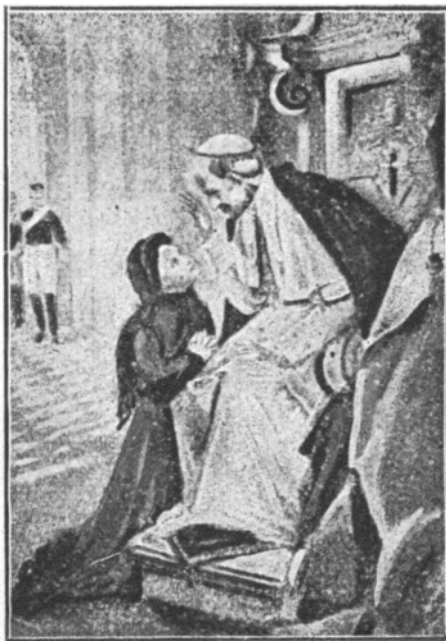
Terezka pred pápežom Levom XIII.