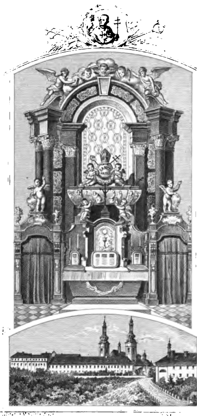
Oltář sv. Norberta v chrámu Páně na Strahově v Praze.