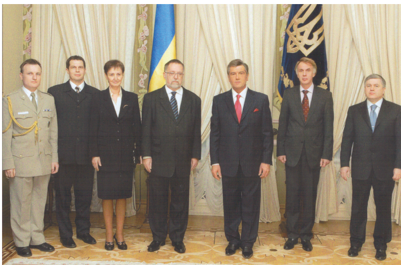
Kyjev - nový velvyslanec ČR na Ukrajině předal pověřovací listiny prezidentovi Ukrajiny Viktoru Juščenkovi (2007)