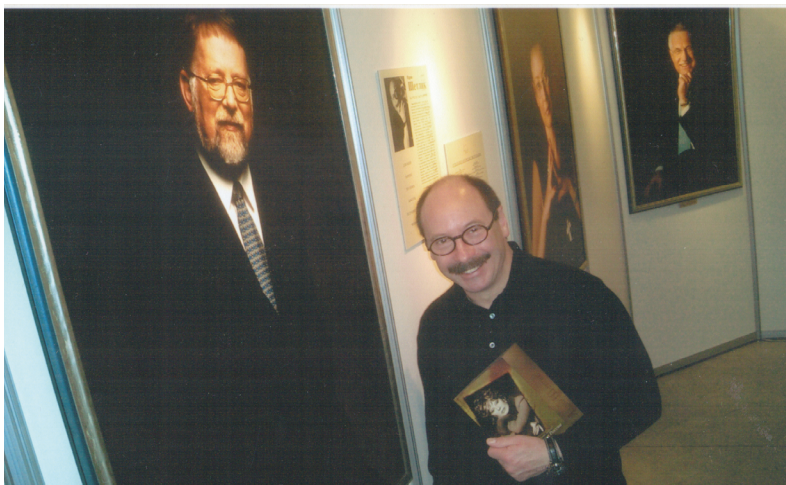
Výstava obrazů J. Š., který unikátní technologií zachycuje portréty osobností na malířské plátno (2006)