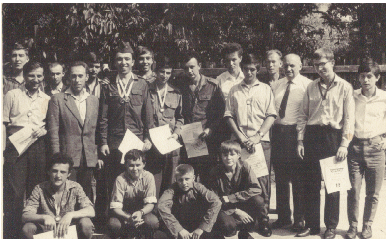
Louny – okresní přebor v šachu (1965), J. B. druhý zprava