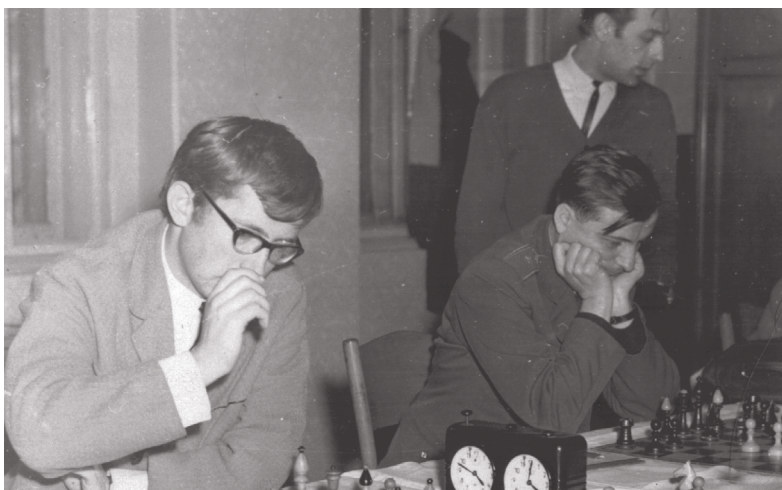
Šachový zápas (1966), J. B. hrál za Duklu Žatec.