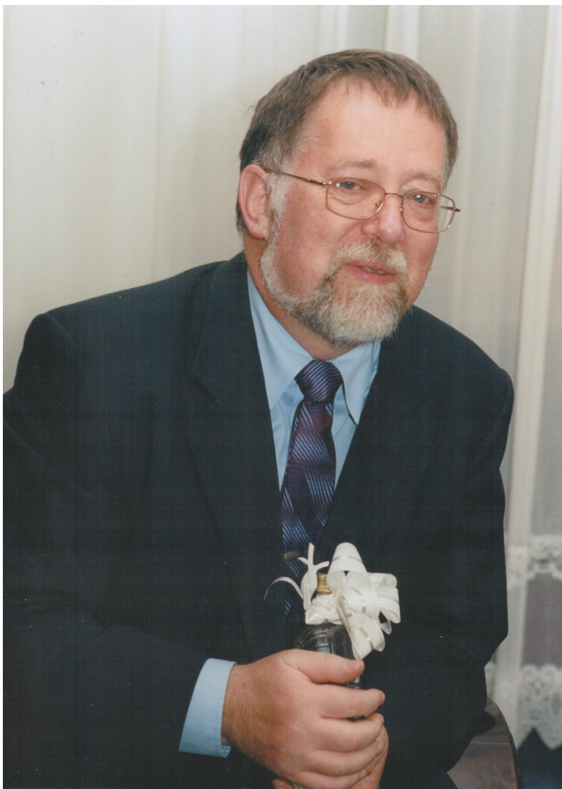
Velvyslanec ČR v Rusku J. B. (2002)