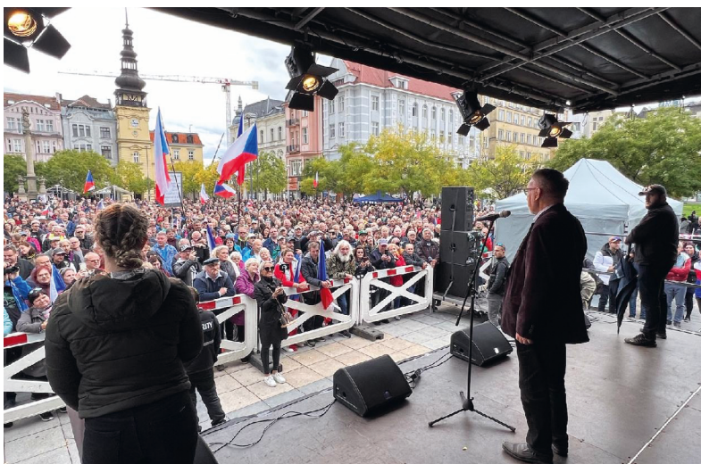
Poslanec J. B. mluví k občanům na demonstraci v Ostravě (2022)