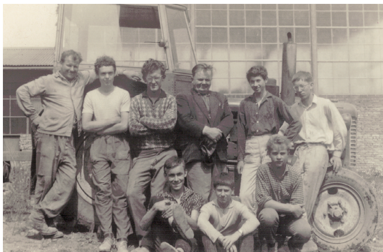
Chmelová brigáda středoškoláků (1965), J. B. první zprava