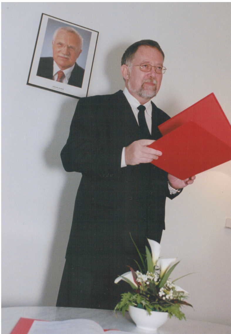
Velvyslanec J. B. v roli oddávajícího na ambasádě v Moskvě (2004)