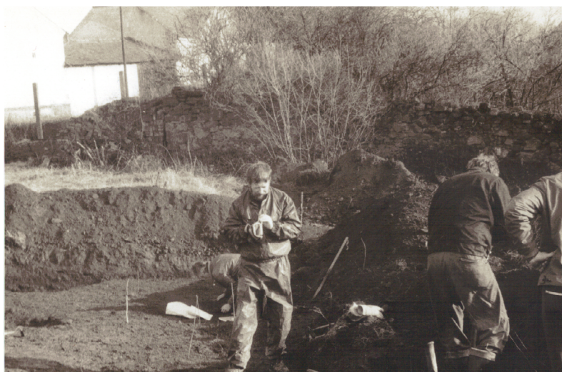
Plasy – archeologický záchranný průzkum (1982)