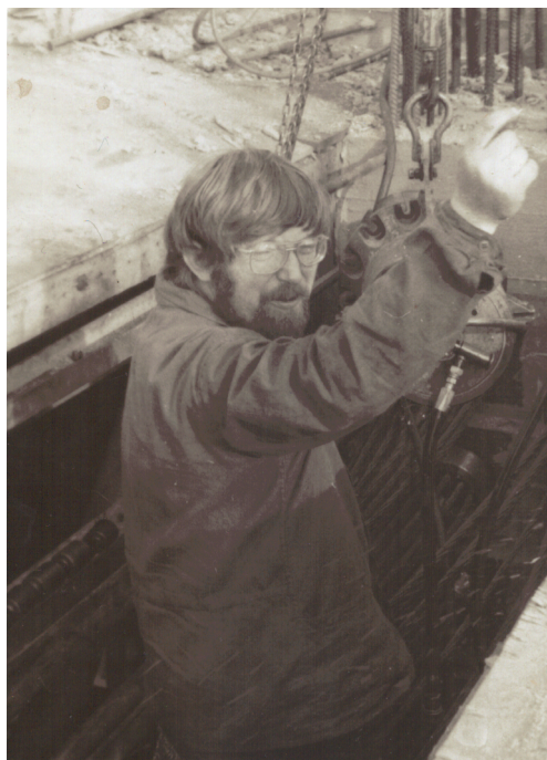
Na stavbě dálničního mostu v Berouně (1984?)