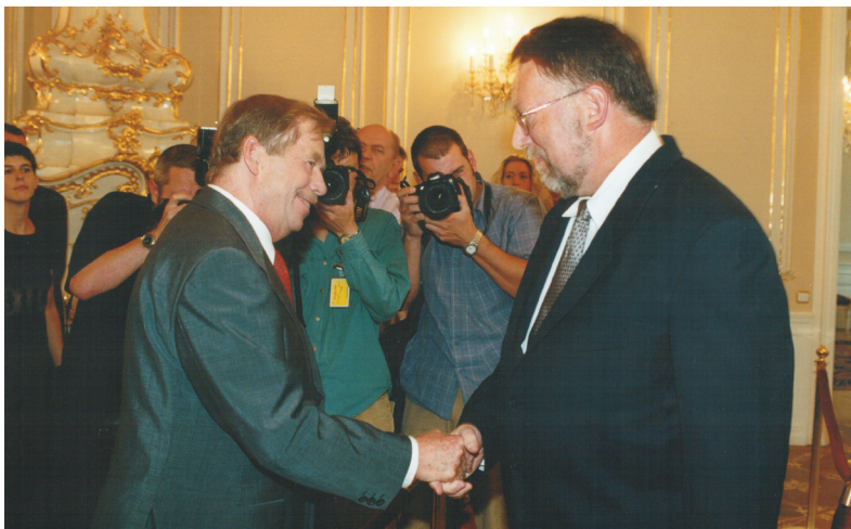
J. B. s prezidentem Václavem Havlem při poradě velvyslanců (2001)