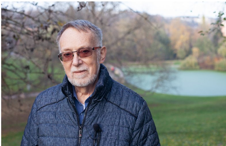
Poslanec J. B. na procházce pražským Břevnovem (2022)