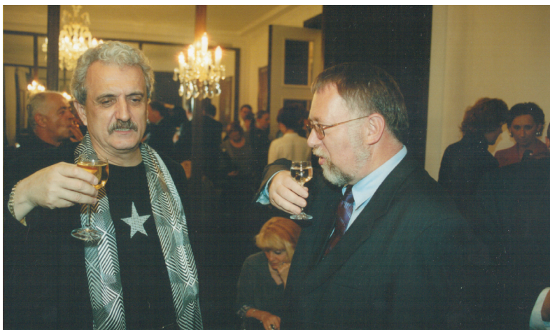
Velvyslanec J. B. na recepci v Moskvě při návštěvě ministrů Zemanovy vlády s Pavlem Dostálem (2002)