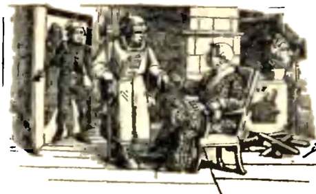
Proměny měsíce a povětrnost

Dne 1. jest 28. Tebeth; dne 3. 1. Šebat; dne 31. 29. Šebat. V rusko-řeckém kalendáři jest dne 13. nový rok 1870.