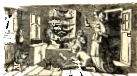
Proměny měsíce a domnělá povětrnost.

Dne 1. jest 7. Kislev; dne 19. 25. Kislev, posv. chr.; dne 25. 1. Tebeth; dne 31. 7. Tebeth.